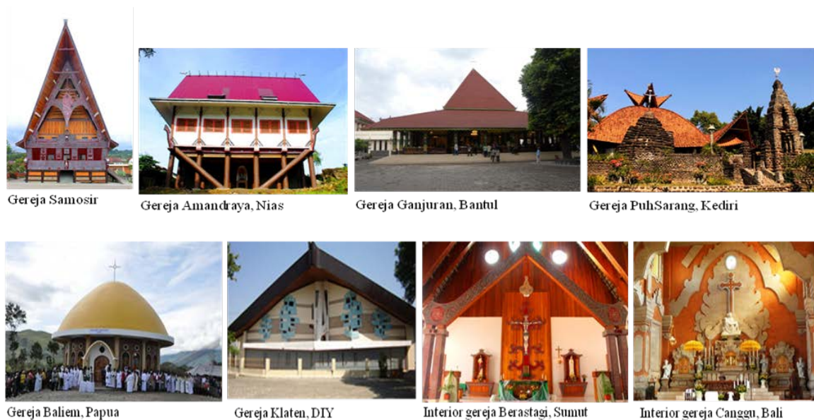
Gambar 1 Ragam Arsitektur Gereja Katolik di Indonesia dalam Proses Inkulturasi

dengan kacamata iman Katolik. Proses ini menempatkan Gereja dan masyarakat setempat pada posisi untuk mentaati kebudayaan dengan berbagai nilai moral yang sejalan dengan kehidupan gerejani [7,8]. Konsili Vatikan II merupakan pernyataan formal dari proses inkulturasi tersebut. Di Indonesia, proses inkulturasi pada agama Kristen sesungguhnya sudah terjadi jauh sebelum Konsili Vatikan II. Usaha lembaga Gereja dalam menjalankan prinsip inkulturasi antara lain tercermin dalam berbagai usaha untuk memperbaharui upacara keagamaan di lingkungan Gereja dengan semakin banyak upacara lokal tradisional yang diterima dan digunakan dalam berbagai ritual Gereja Katolik dengan perubahan seperlunya [8,9]. Meskipun Konsili Vatikan II tersebut tidak secara langsung merujuk pada bentuk arsitektur Gereja, namun pada akhirnya semangat dan proses inkulturasi juga mewujud dalam bentuk arsitektur Gereja, yang semakin meninggalkan bentuk arsitektur Gotik. Di berbagai lokasi di Indonesia, terlihat arsitektur gereja Katolik yang bernafaskan arsitektur lokal baik dalam bentuk keseluruhan maupun dalam tatanan ruang dalamnya (gambar 1)