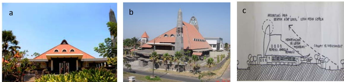
Gambar 3 Faktor kontekstual pada tampilan arsitektur Gereja Roh Kudus, Surabaya

Bentuk dan material atap dirancang menyerupai bangunan di sekitarnya. Demikian pula pemilihan material pada semua elemen arsitekturnya, seperti penggunaan batu alam pada kolom-kolom bangunan, kayu ditujukan untuk membentuk kesesuaian dengan lingkungan (gambar 3a, b). Teknologi konstruksi-baja dan beton prategang, memungkinkan pembentukan ruang berbentuk besar, namun tetap dengan penampilan langgam arsitektur lokal.