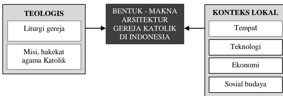
Gambar 2 Faktor Pengaruh Pada Bentuk dan Makna Arsitektur Gereja Katolik

Aspek fungsi selalu berkaitan dengan konteks, dan aspek makna berhubungan dengan interpretasi dari fungsi dan bentuk tersebut. Hubungan antara bentuk arsitektur dan maknanya dipengaruhi oleh berbagai aspek yang berada di luar arsitektur, baik yang merupakan kekuatan tetap/tidak berubah, maupun kekuatan yang cenderung berubah-ubah (gambar 2).