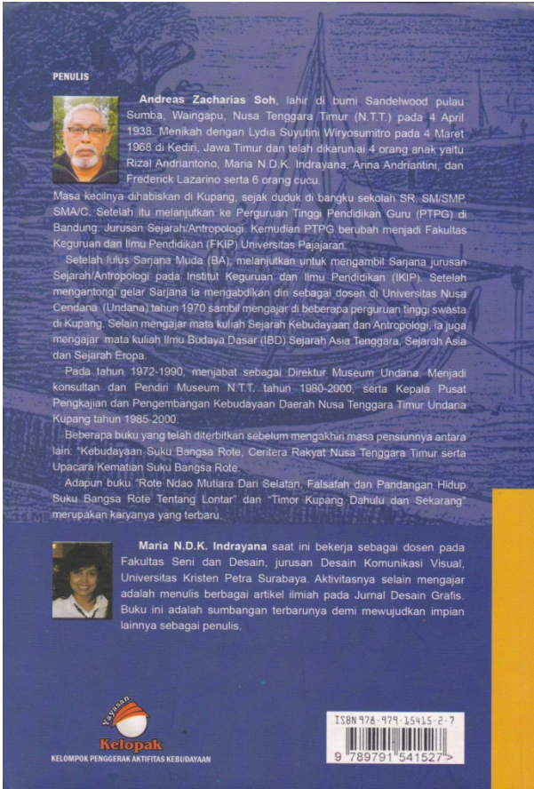
Cover depan dan belakang