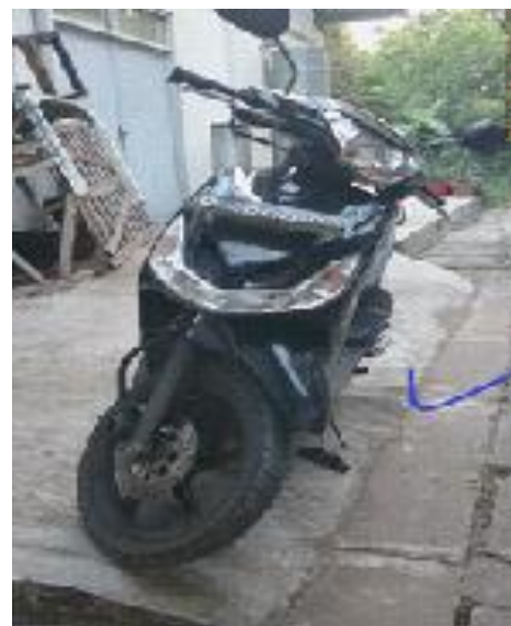
Gambar 3. Percobaan pada Lantai Miring

Setelah menggunakan sidestand automatic maka dilakukan prosedur pengembalian sidestand ke posisi awal (semula). Prosedur pengembalian sidestand ke posisi awal yaitu hanya menekan tombol ke posisi OFF dan dilakukan penekanan tombol RESET . Saat actuator memendek maka dibagian atas terdapat limit switch yang bertujuan sebagai pembatas actuator atau memberitahukan bawah actuator sudah pada posisi awal.