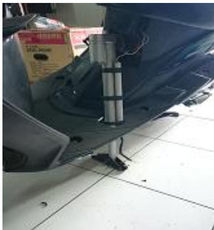
Gambar 2. Automatic Sidestand

Sudut kemiringan automatic sidestand didesain mengikuti sudut kemiringan original sidestand pada saat area parkir rata. Hasil desain automatic sidestand untuk berbagai macam kondisi area parkir dapat dilihat pada Gambar 2.