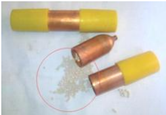
Gambar 3. Serbuk dalam Filter Dryer