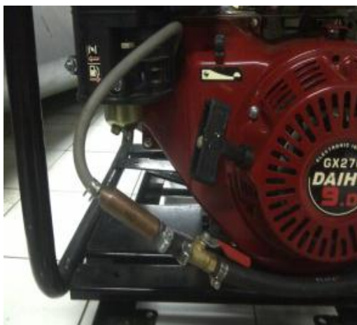
Gambar 4. Pemasangan Filter Dryer dan Valve pada Engine Pompa Air Irigasi

Valve adalah alat yang berfungsi untuk mengatur secara akurat aliran dari yang daerah bertekanan tinggi ke daerah yang bertekanan lebih rendah. Pemilihan valve ini supaya biogas dapat lebih mudah diatur dengan putaran valve yang lebih tepat dan akurat seperti terlihat pada Gambar 4.