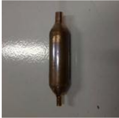
Gambar 2. Filter Dryer