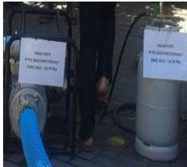
Gambar 5. Irrigation Water Pump saat Menggunakan Biogas

Pada penelitian ini telah berhasil dibuat dan diaplikasikan Irrigation water pump berbahan bakar biogas ( inhibitorless biogas fuel ) seperti terlihat pada Gambar 5. Kotoran sapi sebagai bahan baku penghasil biogas dapat dimanfaatkan sebagai bahan bakar irrigation water pump sehingga dapat mengurangi pencemaran lingkungan dan efek rumah kaca. Pemilihan mesin dalam penelitian ini telah dilakukan untuk mesin berbahan bakar bensin.