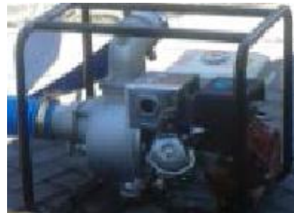
Gambar 1. Pompa ZB100 dan Engine GX270