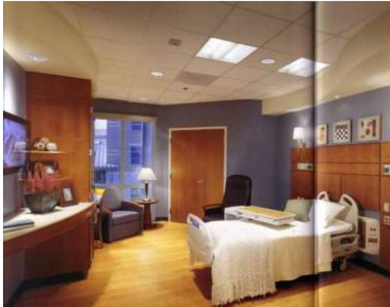
Gambar 3. Foto Kamar Rawat Inap di Clarian West Medical Center

( http://healthcaredesignweb.org/HWmem/case/hospital.asp?hospital_id=4&hospital_name=Clarian%20West%20Medical%20Center&id=1 ) 34