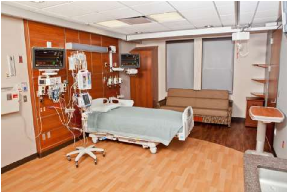
Gambar 1. Acuity adaptable care private patient rooms

Sementara contoh lain untuk kualitas ruang rawat inap didapat pada Clarian West Medical Center, Avon Indiana, USA , Interior Kamar Rawat Inap dari Clarian West Medical Center, Avon Indiana, USA memiliki warna yang menarik karena itu kasus ini disertakan dalam studi kasus ini. Clarian West Medical Center, Avon Indiana, USA yang dikelola oleh Indiana University Health yang paling komprehensif di Indiana dan bermitra dengan Indiana University School of Medicine , salah satu sekolah terkemuka di kalangan medis, memberikan pasien akses ke perawatan inovatif dan terapi ( http://iuhealth.org/ 31 dan Boekel, A., (ed), 2008) 32.