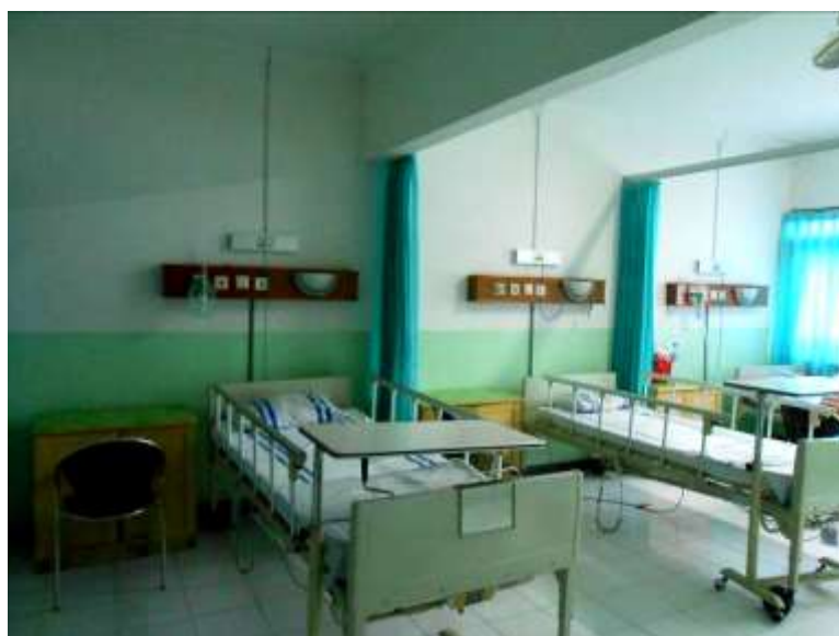
Gambar 5. Foto Ruang Rawat Inap Kelas II di Paviliun RS X