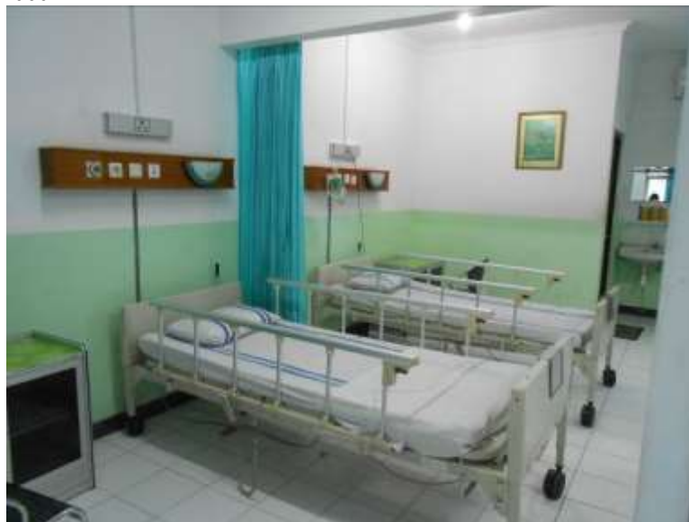
Gambar 4. Foto Ruang Rawat Inap Kelas III di Paviliun RS X