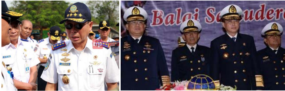
Gambar 2. Seragam Dinas Perhubungan yang mirip seragam militer.

Seragam yang digunakan oleh Menteri Perhubungan tahun 2014-2016 terlihat mirip dengan seragam yang digunakan perwira tinggi TNI. Lengkap dengan tanda 4 bintang warna kuning emas di atas bahunya (Kompas, 10 Juli 2015). Panglima TNI secara pribadi justeru menganggap hal itu justeru menjadi suatu kebanggaan bagi TNI, karena setidaknya terdapat dua kementerian yang seragam dinasnya mirip TNI. Dikatakan Jendral Gatot bahwa Kemenhub, TNI, dan Kemenkumham itu adalah instansi di bawah presiden. TNI tidak bisa mengoreksi mereka. Baginya justeru menjadi kebanggaan bahwa terdapat instansi lain yang ingin tampil seperti TNI (newsliputan6.com. diunduh 7 Januari 2017) .