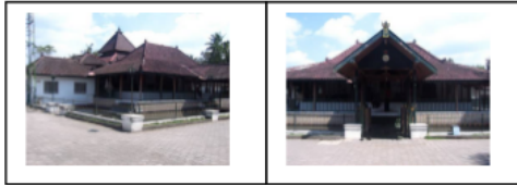
Gambar 1. Masjid Ploso Kuning

Kuning didirikan di atas tanah kasultanan seluas 2.500 m 2 . Bangunan masjid pada saat didirikan seluas 288 m 2 dan setelah pengembangan menjadi 328 m 2 .