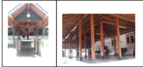
Gambar 2. Tratag Rambat & Serambi Masjid Ploso Kuning

mereka adalah 'sarana' bagi orang untuk melakukan inisiasi menuju yang sakral. Sakral sendiri berasosiasi dengan konsep 'pusat'. Pusat adalah serba 'lebih' sedang pinggir atau luar adalah 'rendah'. Dengan demikian kemunculan interpretasi seperti ini seakan usaha untuk 'mengembalikan' legitimasi konsep 'pusat'.