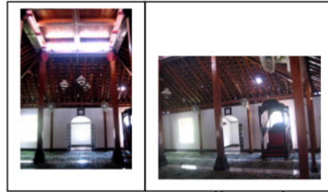
Masjid Ploso Kuning

Lantai masjid awalnya diplester, dan pada tahun 1976 diganti menggunakan tegel biasa. Demikian juga deng 4 daun pintu masjid yang awalnya hanya satu dan sangat rendah menyebabkan ruang masjid menjadi gelap, dan pada tahun 1984 jumlah pintu ditambah menjadi tiga dan jendela pada ruang masjid, sehingga ruang menjadi terang. Adapun pintu yang rendah merupakan 4 simbol tata krama dan kesopanan, agar setiap orang yang masuk hendaknya menunduk dan menunjukkan tata krama dan sopan santun di masjid.