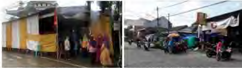
Gambar 2. Acara Pernikahan, Perdagangan, Pasar Di Ruang Jalan