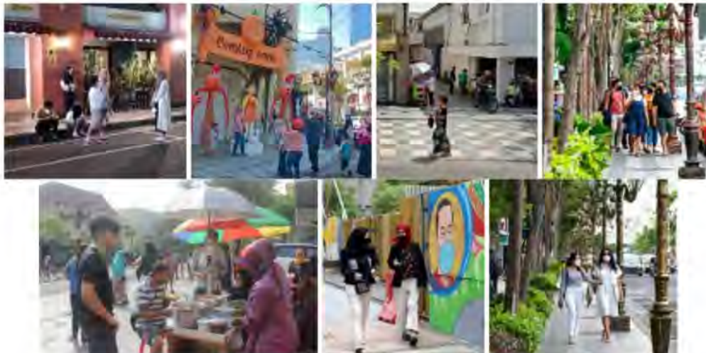
Gambar 9. Ragam Subjek Sosial Di Jalan Tunjungan