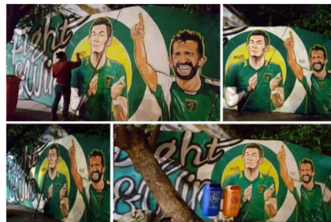
Gambar 6. Mural di Jl. Darmo Kali

Visual mural berikutnya adalah mural yang dibuat di kawasan Jl. Genteng Kali sebelah jembatan menuju kawasan Undaan, Surabaya. Berada di tengah kota yang terhubung dengan gedung bersejarah bernama Siola serta akses menuju TP maupun ke kawasan kota lama, Undaan.