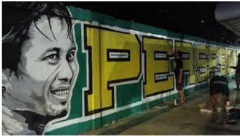
Gambar 3. Mural yang dikerjakan oleh Bonek

menjadi dukungan positif dan berbagai kata motivasi lain yang dipadukan dengan gambar pemain Persebaya maupun legenda yang dimiliki oleh Persebaya. Seni mural yang dibuat oleh Bonek menjadi tonggak penting terjadinya transformasi bentuk seni mural di Surabaya. Selama ini mural di Surabaya dikerjakan oleh seniman mural yang bergerak di bawah tanah yang tidak memiliki ijin dari otoritas kota maupun pemilik tembok. Seiring dengan kembalinya Persebaya bertanding, mural di Surabaya dikuasai oleh mural yang bertemakan Persebaya. Mural yang seperti ini sering disebut sebagai mural Bonek, karena dikerjakan oleh Bonek dan bertemakan tentang dukungan pada Persebaya. Tak jarang mural ini kemudian menjadi tempat ( spot ) dalam mendokumentasikan kehadiran seseorang di Surabaya melalui foto dan kemudian disebar-kan ke media sosial.