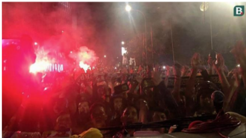
Gambar 10. Bonek menjemput bus yang mengangkut pemain Persebaya di Bundaran Waru

Jauh-jauh hari Bonek sudah memberi pernyataan, bahwa jangan sampai kalah menghadapi Arema. Namun rupanya Persebaya kalah. Meski begitu, pemain Persebaya menunjukkan semangat tempur yang tinggi di tengah intimidasi Aremania, suporter Arema. Penonton yang merangsek masuk lapangan saat istirahat babak pertama dengan merobek logo Persebaya serta memprovokasi pemain Persebaya yang sedang melakukan pemanasan, tetap membuat tidak gentar pemain Persebaya. Hal inilah yang kemudian mendapatkan kesan positif dari Bonek. Malam harinya saat pemain Persebaya kembali dari Malang, ribuan Bonek menjemput di Bundaran Waru, titik masuk kota Surabaya (Gambar 10). Mereka tetap mengapresiasi permainan pantang menyerah meskipun kalah.