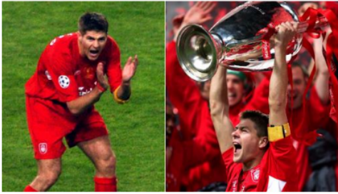
Gambar 9. Gestur Steven Gerrard saat bertepuk tangan memberi motivasi