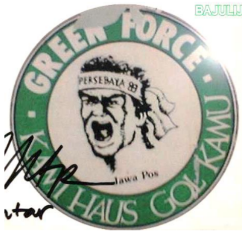
Gambar 1. Logo Bonek awal

Jawa Pos saat itu merupakan sosok di belakang layar untuk pengoordinasian suporter. Tercatat pula bagaimana identitas yang dipakai dalam kaus suporter Persebaya (dikenal sebagai wong mangap ) itu kini bahkan menjadi logo Bonek (Gambar 1 dan Gambar 2). Peristiwa tersebut kemudian diberitakan secara besar-besaran oleh media massa Jawa Pos sehingga memperoleh porsi perhatian yang luas dari masyarakat maupun pendukung klub lain. Bonek mulai identik dengan fan Persebaya Surabaya saat mulai sering dipakai nama tersebut di awal-awal tahun 2000-an.