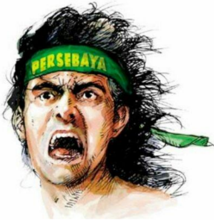
Gambar 2. Logo Bonek yang dipakai hingga kini

Bonek kemudian menjadi representasi Jawa Timur bukan hanya Surabaya. Bonek tersebar di mana-mana termasuk di kota-kota Jawa