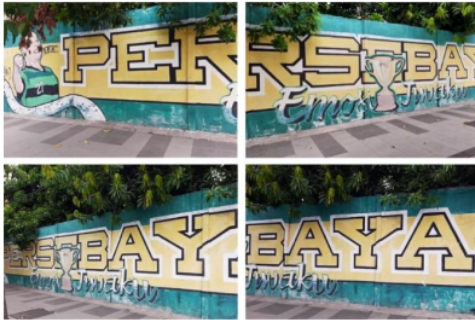
Gambar 5. Mural di Jl. A. Yani (2021)

Berikut ini visual mural yang dibuat oleh Gate17 serta bagaimana interpretasi komposisi yang terbentuk dari mural yang dibuat. Interpretasi komposisi digunakan untuk melihat gambar “apa adanya” dan memahami signifikansinya dalam the site of an image itself (Rose, 2001: 34).