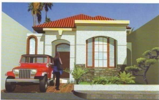
Gambar 1.a. Tampak Depan

Tampak/denah rumah sederhana satu lantai di daerah Surabaya Barat (Gambar 1a dan 1b)