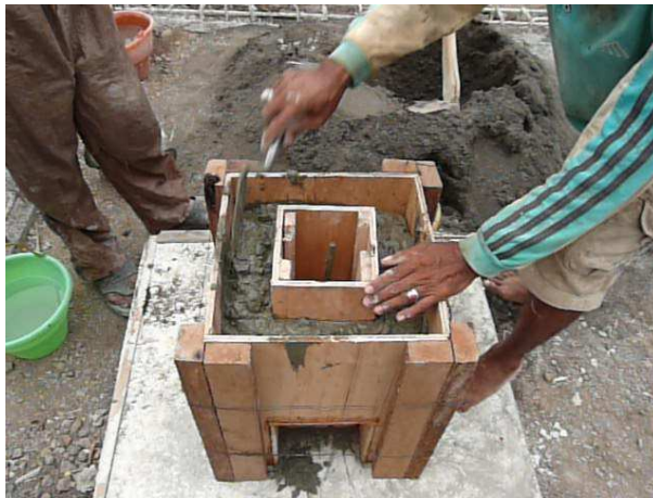
Gambar 3. Pengecoran Pondasi Tapak