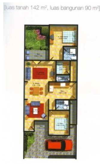
Gambar 1.b. Denah Organisasi