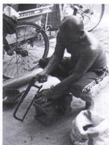
Gambar 4. Tahapan pemotongan bagian sendok cethok