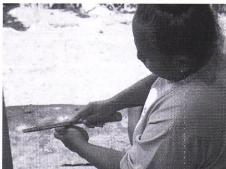
Gambar 5. Tahapan pengikiran dan pengamplasan pinggiran sendok cethok