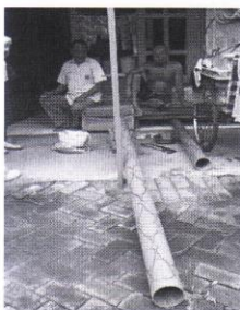
Gambar 3. Tahapan penyalinan pola bagian sendok cethok

Tahapan-tahapan produksi cethok yang diperoleh dari observasi mahasiswa adalah sebagai berikut: penyalinan pola bagian sendok cethok ; pemotongan bagian ujung dan pinggir sendok cethok ; pengikiran dan pengamplasan pinggiran sendok cethok ; pembersihan dan pemotongan pegangan cethok ; penandaan batas belah dan pembelahan gagang cethok ; penekanan ( pressing ) pegangan cethok ; pemotongan pegangan cethok ; pengikiran dan pengamplasan pinggiran sendok cethok ; penyesuaian posisi; pengeboran batang; pengeleman gagang dan sendok; pemasangan baut keling; pemotongan tali dan pemasangan tali tutup pegangan cethok ; pemasangan tutup pegangan cethok ; pengguntingan label, pemasangan label; dan pengecekan kualitas.