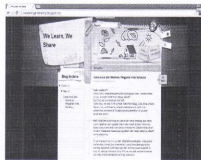
Gambar 8. Desain Website http://welearningandsharing.blogspot.com/