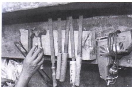
Gambar 2. Peralatan untuk Usaha Cetak

Usaha cethok Pak Hariyono dan kawan-kawan dirintis sejak tahun 2006, dengan modal awal Rp. 300.000,- dan 50 orang tenaga kerja. Bahan baku produksi cethok ialah: pipa PVC, senar raket, penutup pipa belakang, paku, amplas, lem PVC, minyak tanah (untuk kompor pemanas). Beberapa alat yang dibutuhkan untuk produksi cetok antara lain gergaji, bor, kikir.