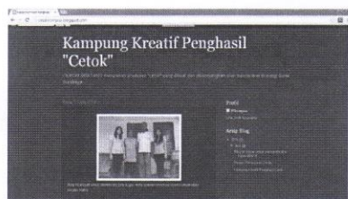
Gambar 7. Desain Website http://cetokkompos.blogspot.com/

Salah satu usulan dari analisis SWOT ini adalah penyusunan website promosi. Mahasiswa kemudian berusaha membuat blog sederhana guna mempromosikan Kampung Bratang Tangkis dan usaha cetok masyarakat melalui blog http://cetokkompos.blogspot.com/ dan http://welearningandsharing.blogspot.com/ . Ternyata sampai saat ini dirasakan bahwa media pemasaran ini masih perlu dikembangkan mengingat masih belum dikenalnya produksi cethok ini secara nasional dan belum berlanjutnya pesanan dari pasar yang ada.