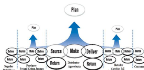
Gambar 1. SCOR model produk apel

Supply Chain Operations Reference (SCOR) model adalah sebuah model yang dibangun oleh The Supply Chain Council. Model ini digunakan untuk memetakan, memberikan perbandingan dan memperbaiki operasi dari satu rantai pasok (Person dan Araldi, [5]). Model SCOR produk apel di Jawa Timur berdasarkan hasil wawancara dapat dilihat pada Gambar 1.