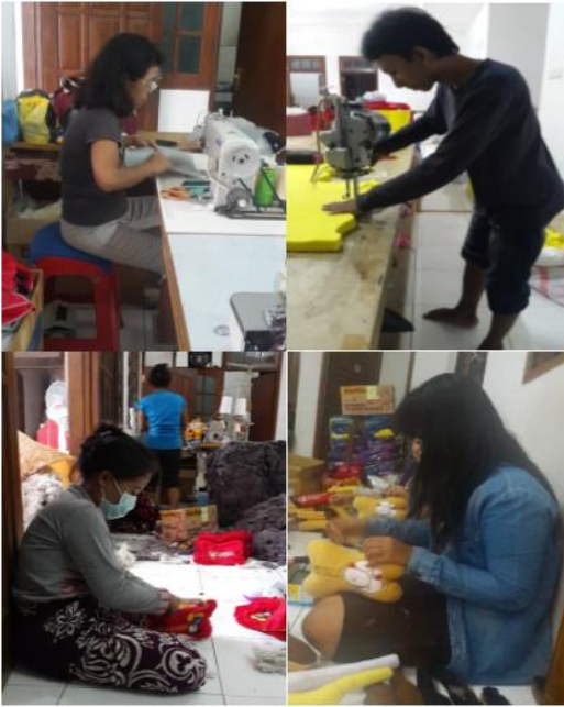
Gambar 3. Kegiatan Pekerja di UD. XYZ

Penilaian pada posisi tubuh pekerja dapat dilihat pada RULA employee assessment worksheet (Ergoplus, 2016). Foto saat bekerja tersebut akan dinilai dengan mengukur sudut-sudut pada beberapa bagian tubuh yang dibutuhkan pada pengukuran menggunakan metode RULA. Beberapa penilaian pada RULA juga membutuhkan pengamatan pada gerakan, posisi, dan beban alat saat melakukan pekerjaan.