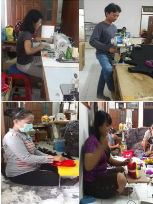
Gambar 4. Hasil penerapan usulan perbaikan pada postur tubuh pekerja UD. XYZ Usulan tersebut antara lain:

menggunakan RULA yang sebelumnya telah dilakukan. Rata-rata pekerja memiliki posisi tubuh saat bekerja dengan score 3-5 yang artinya butuh pertimbangan lebih lanjut dan analisa kembali pada postur tubuh tersebut. Hasil postur tubuh setelah dilakukan perbaikan dan usulan dapat dilihat pada Gambar 4.