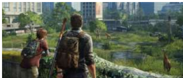
Gambar 1. Footage The Last of Us

Dalam industri video game, perkembangan teknologi ini terlihat dari makin variatifnya gameplay dan tampilan grafis yang ditampilkan. Efek lanjutan dari hal ini berdampak pada tata cerita dan tata visual yang menjadi inti dari sebuah judul video game. Dalam beberapa tahun ini, video games dengan genre cerita post apocalyptic cukup menjadi perhatian serta meraup keuntungan yang cukup besar. Beberapa contoh diantaranya seperti: The Last of Us yang dikembangkan oleh Naughty Dog yang terjual 1,3 juta salinan pada minggu pertama peluncuran dan mencapai 17 juta salinan pada 2018 (Tassi, 2013).