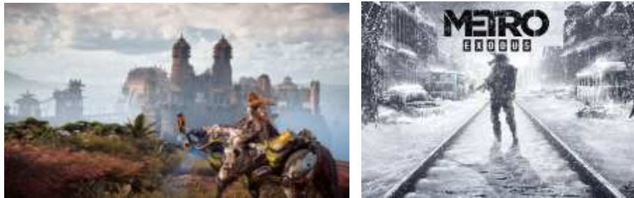
Gambar 2. (kiri) Footage game Horizon Zero Dawn dan (kanan) cover game Metro Exodus

game dengan genre cerita post apocalyptic , pengembang 4A Games meluncurkan judul Metro Exodus (kelanjutan seri Metro) pada Februari 2019. Metro Exodus mendapat nominasi dari majalah Develop untuk kategori Best Visual Arts dan Game of The Year . (Blake, 2019).