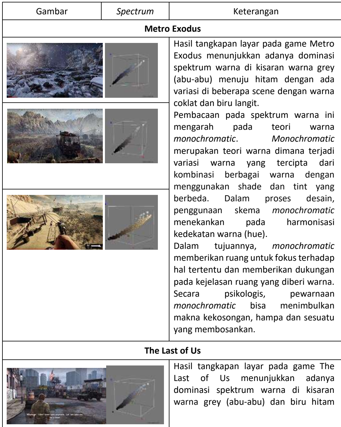
Tabel 1. Tabel analisis spektrum warna [Sumber: Dokumen Penulis]