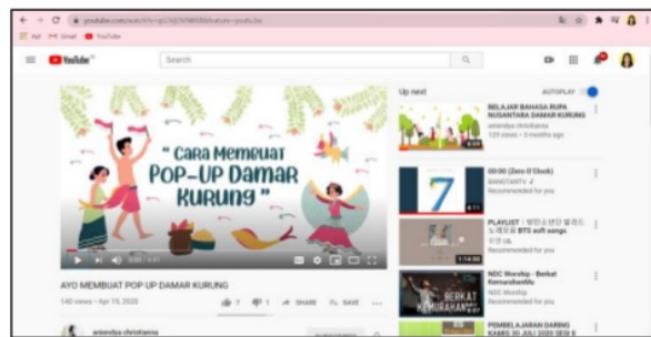
Gambar 3. Tampilan Video Tutorial Cara Membuat Pop-up Damar Kurung

Modul pop-up yang disiapkan telah dilengkapi dengan video tutorial yang dapat dilihat di Youtube ( https://youtu.be/qG3VjDVIWR8 ). Video tutorial ini berdurasi 4 menit 41 detik (Gambar 3). Setiap langkah-langkah pembuatan ditampilkan secara mendetail satu per satu dengan keterangan tulisan dan juga tampilan tangan yang memeragakannya. Video diiringi dengan instrumen musik “The Biggest Smile” yang ceria dan semangat untuk membuat proses perakitan pop-up Damar Kurung menjadi semakin seru. Secara visual, gambar-gambar yang digunakan pada modul dan video tutorial ini sama, yaitu menggunakan ilustrasi flat design . Gambar yang sederhana dan berwarna-warni tersebut disesuaikan dengan gambar Damar Kurung asli. Video tutorial dibuat dengan menggabungkan video langsung dan stop motion agar tetap menarik dan juga informatif.