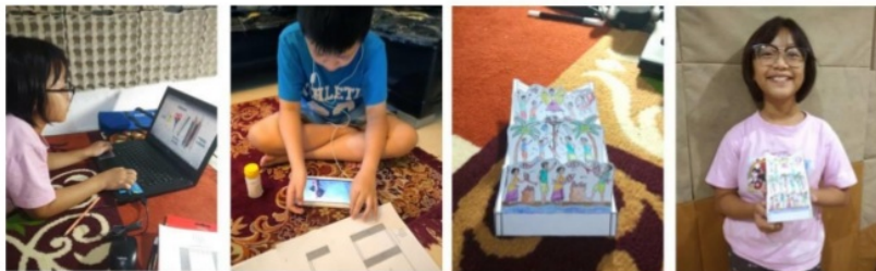
Gambar 4. Uji Coba Modul dan Video Tutorial Pop-up Damar Kurung oleh target audience

Modul dan video tutorial di atas telah diujicobakan kepada anak-anak dan mendapat respon yang positif (Gambar 4). Modul dan video dikirimkan secara online , kemudian diunduh dan di- print masing-masing. Melalui media-media tersebut, anak-anak dapat memahami tentang konsep Damar Kurung dan juga dapat merakit modul pop-up secara mandiri tanpa bantuan orang dewasa. Hal tersebut menunjukkan bahwa media yang dirancang mudah dipahami oleh anak-anak baik itu materi tentang Damar Kurung, konsep visualnya, cara merakitnya, dan cara memainkannya. Video yang diberikan juga dapat ditonton berulang kali maupun di- pause , sehingga anak-anak dapat mengikuti setiap langkah perakitan dengan dengan baik.