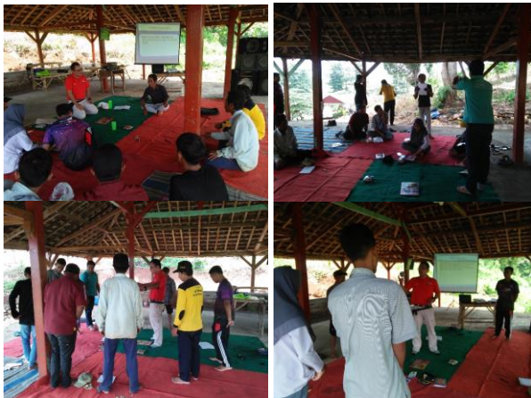
Gambar 3. Tahapan dalam memberikan materi outbound kepada peserta

Tahapan ini dilakukan untuk memberikan pengenalan tentang outbound kepada para peserta outbound. Pada tahap ini diberikan materi-materi yang terkait dengan outbound dan bagaimana mengunggah kerjasama tim panitia dalam membuat outbound yang menarik bagi para peserta. Tahapan materi outbound diberikan dengan tahapan mengenal orientasi medan (Gambar 3).