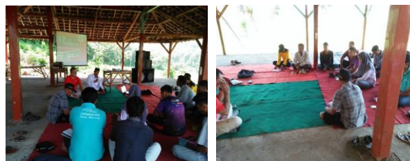
Gambar 2: Foto Pengenalan dan Pengarahan Para Peserta

Desa Kebontunggul telah merintis desa wisata, tepatnya sebagai wisata edukasi terpadu Lembah Bencirang. Desa Kebontunggul terbentuk suatu lembah oleh karena itu memiliki pemandangan alam yang baik karena berada diantara dua pegunungan Welirang dan pegunungan Anjasmoro. Keunggulan tempat wisata yang dimiliki sering digunakan sebagai tempat outbound bagi sekolah-sekolah dan masyarakat yang berada disekitar Mojokerto. Selama ini Desa Kebontunggul khususnya Lembah Bencirang digunakan untuk kegiatan outbound, akan tetapi pelaksana dan pelatih outbound selalu berasal dari luar desa setempat. Berdasarkan hasil identifikasi peserta outbound telah didapatkan 25 karang taruna di desa tersebut, namun yang bersedia untuk mengikuti pelatihan outbound sebanyak 13 orang.