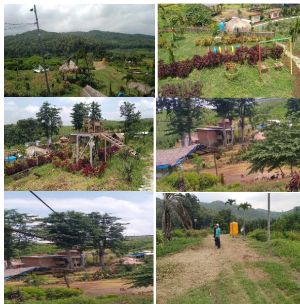
Gambar 3. Identifikasi Potensi Outbound di Lembah Bencirang - Desa Kebontunggul

Tahap kedua dengan mengamati potensi desa yang dapat dibuat untuk wadah pelaksanaan outbound. Desa ini memiliki beberapa potensi outbound yang telah diidentifikasi pada Gambar 3.