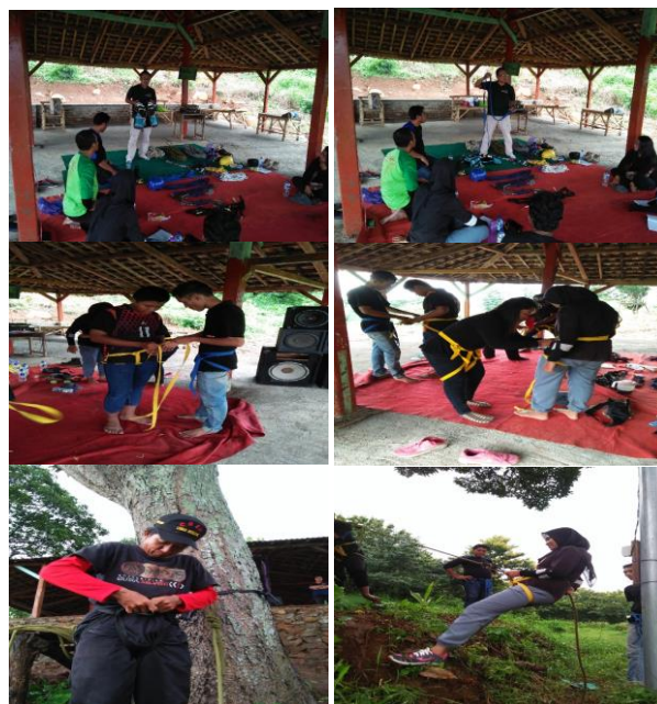
Gambar 4. Cara Penggunaan Peralatan Outbound

Berdasarkan pada Gambar 4 diatas didapatkan kuatnya antusiasme para peserta pelatihan dalam menggunakan peralatan-peralatan yang digunakan saat pelaksanaan outbound. Tahap pertama terlihat bahwa instruktur pelatihan memperkenalkan peralatan-peralatan yang digunakan dalam outbound yang paling diminati yakni flying fox. Tahap kedua para peserta diminta untuk melakukan pemasangan dan memastikan bahwa peralatan yang digunakan telah dipakai dengan benar. Tahap ketiga, peserta secara langsung mempraktekkan penggunaan peralatan dilapangan secara benar dengan mempertimbangkan keamanan dan keselamatan peserta.