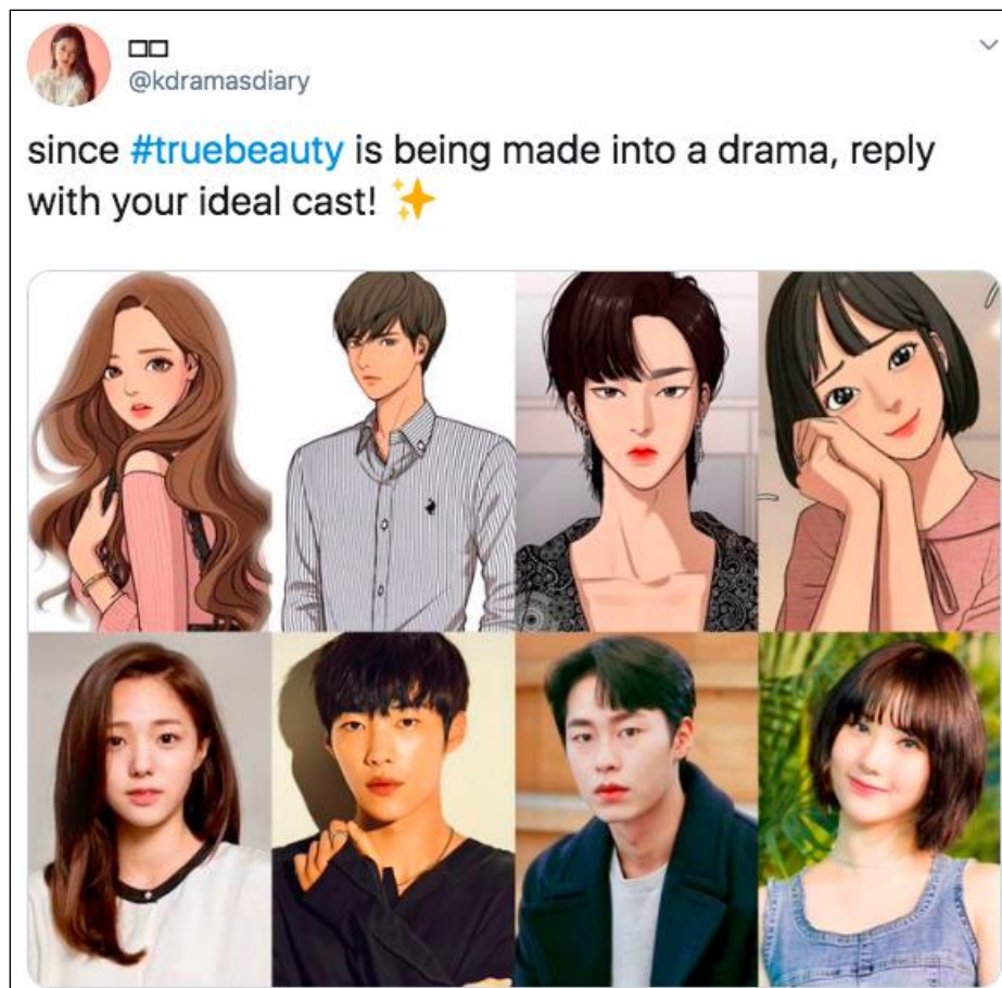
Gambar 3. Tweet @kdramasdiary Untuk Dream Cast #TrueBeauty