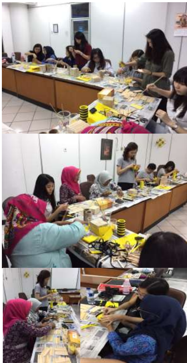
Gambar 1. Kegiatan workshop peserta