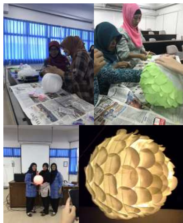
Gambar 4. Proses pembuatan Lampu Lampion.

Setelah mesin jam terpasang, barulah tempat alat tulis dipasang. Tempat tersebut ditempelkan pada bagian atas, kanan, bawah, dan kiri, dimana mewakili angka 3, 6, 9, dan 12. Agar karya ini dapat digantung di dinding, diperlukan kayu balsa yang ditempel membentuk segitiga di bagian belakang penampang. Langkah terakhir yaitu dengan memasang baterai yang membuat jam ini dapat berfungsi dengan baik.