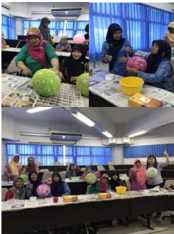
Gambar. 3. Proses pembuatan Lampu Benang.

Karya ketrampilan ini adalah karya yang ramah lingkungan juga karena disarankan menggunakan reuse material yaitu stik es krim bekas yang sudah dikeringkan dan karton plastic wrap . Stik es krim digunakan sebagai penampang jam sedangkan karton plastic wrap digunakan untuk tempat alat tulis. Karya ini membutuhkan 2x84 stik es krim ditambah dengan penguat sekitar 16 stik, serta 4 buah karton plastic wrap yang berukuran 12cm. Bahan pendukung lainnya adalah 1 mesin jam, 1 baterai AA, 4 kain flanel kuning, pita warna hitam, 8 mata, 8 “antena” yang menggunakan putik plastik warna hitam, kayu balsa, cat kuning, cat putih, lem uhu, lem tembak, dan gunting.