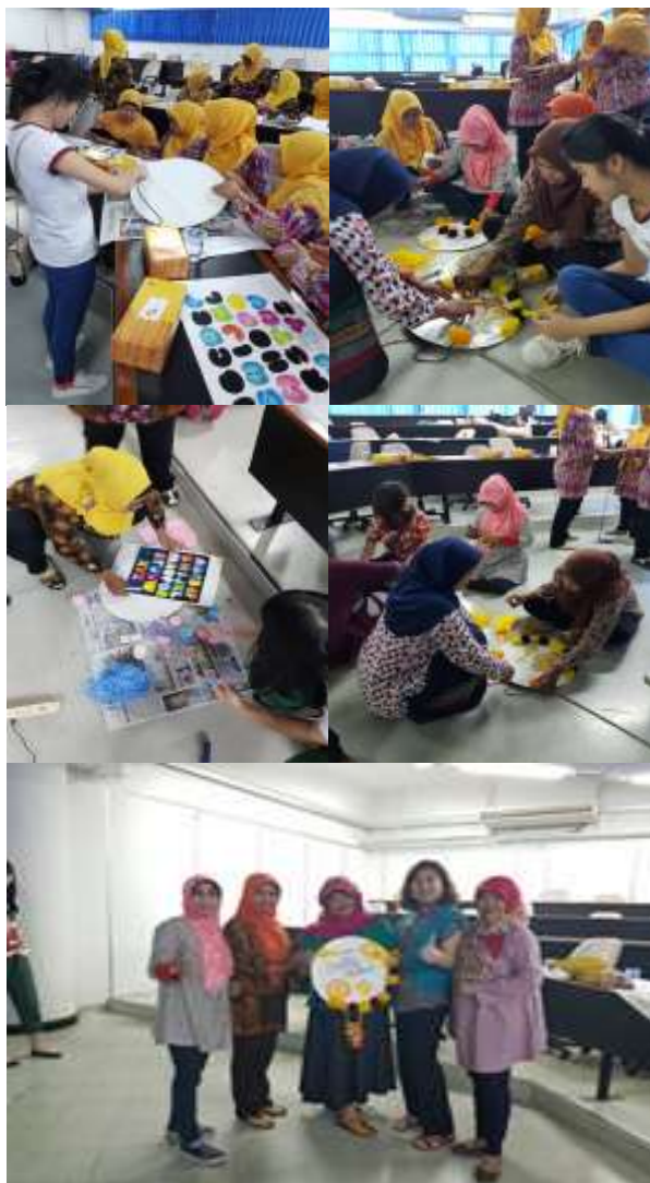
Gambar 5. Proses pelatihan pembuatan Signage

Dari langkah-langkah di atas, para bunda PAUD yang merasa penggunaan stik es krim sangat mudah didapat dan ekonomis. Dan hal ini mencapai tujuan utama karya yaitu memanfaatkan barang-barang yang sudah terbuang menjadi barang yang lebih bermanfaat. Para bunda PAUD ini menyukai bentuk dan warna jam ini karena hasil jadinya lucu dan unik. Penggunaan warna kuning yang cerah bertujuan untuk menarik perhatian anak-anak agar menggunakan karya ini. Pembuatannya cukup mudah, sehingga diharapkan ibu-ibu PAUD dapat berkreasi membuat dan mengembangkan kreativitas jam dinding yang sekaligus berfungsi sebagai tempat penyimpanan alat tulis. Penerapan ini di PAUD masing-masing dengan melibatkan siswa PAUD dapat melatih kreativitas maupun motoric dan sensorik anak.