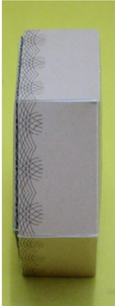
Gambar 4 : Tampak Samping Kiri