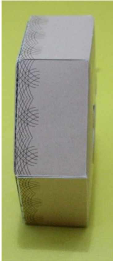
Gambar 5 : Tampak Atas