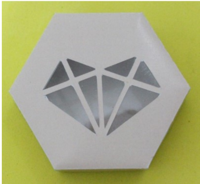
Gambar 1 : Tampak Depan