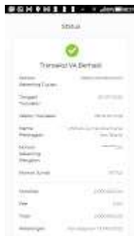
Bukti Pembayaran.jpeg 176K