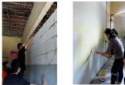
Gambar 5. Pembuatan dinding pembatas kelas dari bata ringan