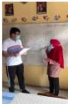
Gambar 9. Wawancara dengan guru