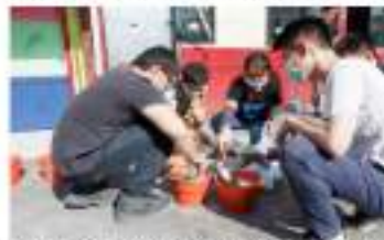
Gambar 3. Penyiapan Perekat Bata

Mahasiswa pada awalnya berkumpul sekitar pukul 7 pagi di depan area SD Margorukun. Pekerjaan ini diawali dengan penyediaan material dan pembagian kelompok secara acak menjadi 3 kelompok kecil yang bertanggung jawab atas tugasnya masing-masing (lihat Gambar 2). Pelaksanaan ini dilakukan dengan 1 kelompok pada awalnya membongkar ketiga pintu yang telah rusak dan mengganti pintu tersebut dengan pintu yang baru. Kemudian setelah memasang kembali pintu tersebut ketempat semula. Kelompok lain melanjutkan pekerjaan dengan memindahkan barang-barang yang ada agar tidak rusak dan mengganggu jalannya perbaikan pada kelas ini. Pada Gambar 3 sampai Gambar 5 dapat dilihat kelompok lain juga membuat semen sebagai perekat bata ringan, menyusun bata ringan di dalam kelas. Bata ringan dipasang satu persatu dan direkatkan satu dengan lainnya menggunakan pasta semen perekat. Bata ringan harus dipasang sesuai dengan senar sebagai acuan agar konstruksi dinding tidak miring. Setelah bata ringan di susun sampai ketinggian tertentu, mulai juga dilakukan melesteran dinding dengan semen khusus. Setelah plesteran mengering barulah dapat melakukan aci pada dinding, sebagai dasar untuk pengecatan dinding.