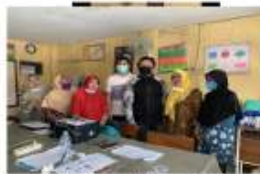
Gambar 8. Pemanfaatan dinding partisi dan kondisi pintu