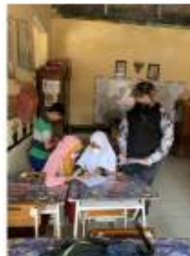
Gambar 10. Wawancara dengan murid