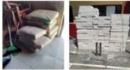
Gambar 2. Penyediaan Material untuk pengerjaan dinding pembatas Civil Care Others 20