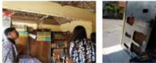
Gambar 1. Survei Kondisi Sekolah Dasar Margorukun bersama Kepala Sekolah