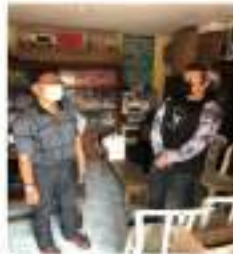
Gambar 7. Wawancara dengan kepala sekolah SD Margorukun.

21 Seperti dapat dilihat pada Gambar 9 dan Gambar 10, kondisi kelas serta para murid yang sedang melakukan kegiatan pembelajaran. Kemudian dilakukan survei kepada murid-murid untuk mengetahui jawaban dari mereka. Setelah melakukan survei kepada anak-anak serta melakukan dokumentasi dengan melakukan foto pada dinding serta pintu yang telah dibuat sebelumnya. Diruang guru ini juga dilakukan survei kepada setiap guru yang ada untuk menanyakan pendapatnya mengenai kegiatan CCO ini sehingga didapatkan jawaban kuisioner yang ditanyakan.