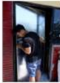
Gambar 4 . Pemasangan pintu kelas yang rusak.