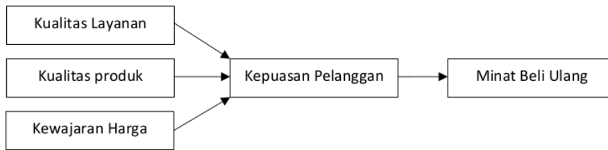
Gambar 1 Model Penelitian