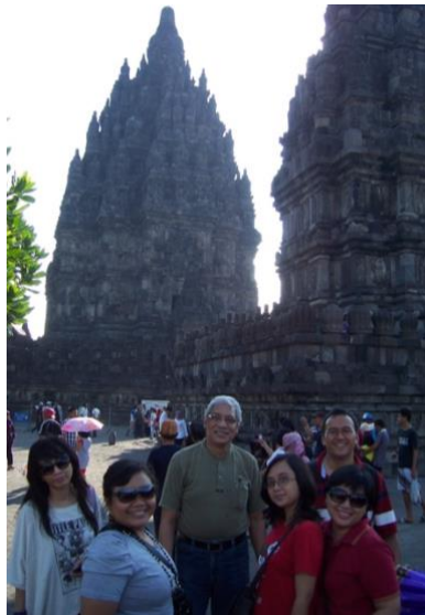
Social gathering bersama tim dari Biro Hubungan Masyarakat UK Petra Surabaya