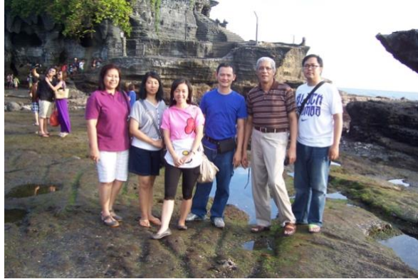
Social gathering bersama tim dari Biro Administrasi Kemahasiswaan dan Alumni (BAKA) UK Petra Surabaya