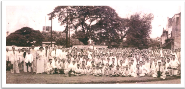
Gambar 4. Kebaktian Kebangunan Rohani (KKR) John Sung di Surabaya tahun 1939.