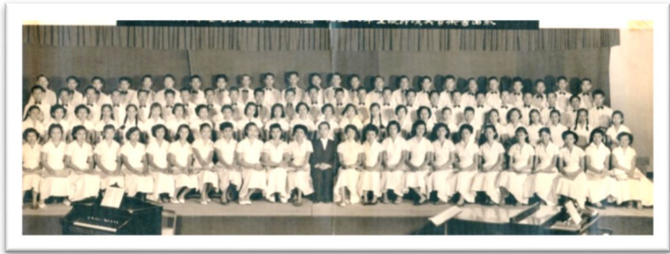
Gambar 3. Koor gabung dialek Hokkian, Kanton, Fuzhou, dan Hinghwa tahun 1956.

Sekalipun sudah banyak Tionghoa yang beragama Kristen, namun masih ada keraguan apakah Kristen adalah agama yang bisa cocok dengan budaya Tionghoa. Oleh sebab itu masih banyak Tionghoa yang menolak menjadi Kristen. Pertanyaan ini dijawab oleh Pdt. John Sung, misionaris dialek Hinghwa, yang dikenal sebagai “Obor Allah di Asia.” Pengaruh Sung tidak hanya di Nusantara namun juga di dunia dalam perkembangan gereja Tionghoa.