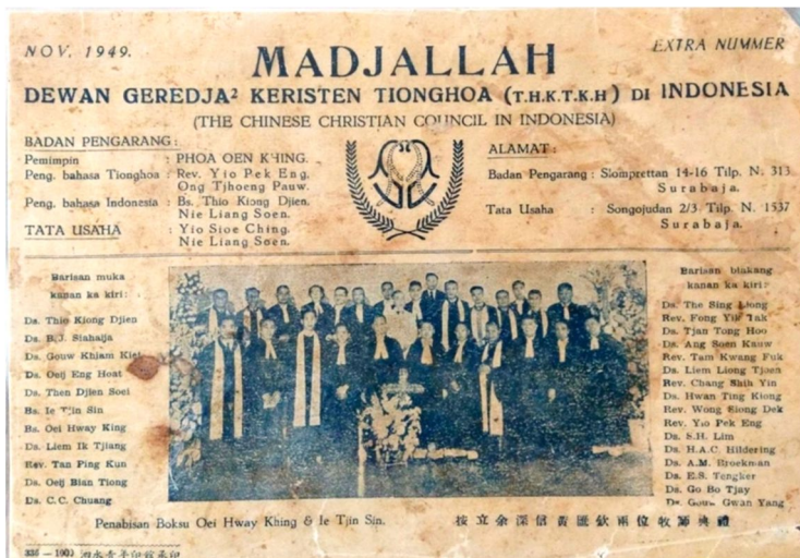
Gambar 5. Halaman pertama majalah THKTKH Indonesia tahun 1949.

Sementara itu, secara nasional terjadi gejolak politik terhadap kewarganegaraan orang Tionghoa di Indonesia pada tahun 1950an sampai 1960an. THKTKH yang hampir semuanya Warga Negara Asing (WNA) diminta untuk menjadi Warga Negara Indonesia (WNI). Terjadi perubahan nama dari Tiong Hoa Kie Tok Kauw Hwee (THKTKH) menjadi Gereja Kristus Tuhan (GKT) dalam Sidang Raya DGI VI di Makassar tahun 1967.