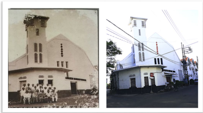
Gambar 2. Tampak depan gereja Tionghoa pertama di Surabaya. Foto kanan tahun 1953. Foto kanan diambil tahun 2019. Tampak depan dijaga sesuai dengan aslinya. Gedung gereja ini termasuk Gedung cagar budaya di Surabaya.

Dana untuk menebus aset tersebut didapatkan dari persembahan jemaat dan pinjaman dari bank di Hong Kong. Untuk pembinaan rohani, dilanjutkan oleh badan misi Netherland Zending Gennotschaap (NZG).