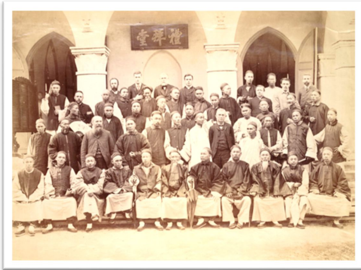
Gambar 1. Para anggota sinode the First Presbyterian of China di Xiamen, Provinsi Fujian pada tahun 1894. Mereka terdiri dari para misionaris Barat dan Tionghoa.

di Provinsi Fujian atau daerah Amoy (Xiamen) menceritakan bagaimana Tionghoa Kristen di daerah pelayanan mereka.