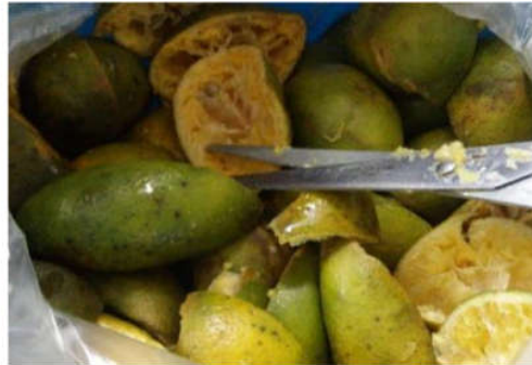
Gambar 1. Limbah Kulit Jeruk ( Citrus sinensis L. Osbeck )

Penelitian ini mengetahui karakteristik unjuk kerja sepeda motor terbaru saat ini tahun 2021 dengan rasio kompresi 1:11. Dimana menurut Kristanto [5] bahwa rasio kompresi mesin dengan 11:1 mesin keluaran 2020 harus memiliki minimal bahan bakar dengan RON 92 keatas. Selanjutnya Ramirez dan Sanches [6] menjelaskan kualitas biomass yang dapat masuk dalam penjualan bahan bakar, bahwa sifat bahan bakar alternatif memiliki parameter unsur yang sama dengan bahan bakar transportasi. Oleh karena itu itu biofuel tidak dapat langsung sebagai bahan bakar, melainkan sebagai bahan bakar campuran sehingga dapat meningkatkan nilai oktan dll. Biofuel untuk bahan bakar transportasi tidak terbatas dengan metode fermentasi seperti, Jonoadji dkk [7] telah melakukan hal yang sama namun dengan metode ekstraksi. Proses ini menghasilkan bahan bakar alternatif untuk jenis campuran bahan bakar diesel. Oleh karena itu potensi sampah organik daun yang sangat besar khususnya sampah pasar berpotensi menjadi biofuel yang cukup besar.