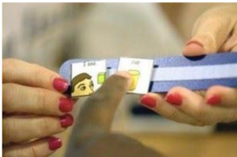
Gambar 2. PECS Card berbentuk print out milik University of Michigan

Similaritas juga dibangun dengan layout desain sistemnya. Salah satunya adalah penempatannya pada tombol. Teks diletakkan di bawah ilustrasinya, sesuai dengan PECS Card di ACTS. Selain itu, kategori kata diwakilkan oleh ikon yang paling merepresentasikan kategori tersebut. Penggunaan teks sebagai penanda kategori sangat dihindari, karena kemampuan membaca 5 calon pengguna ini dinilai masih sangat minim.