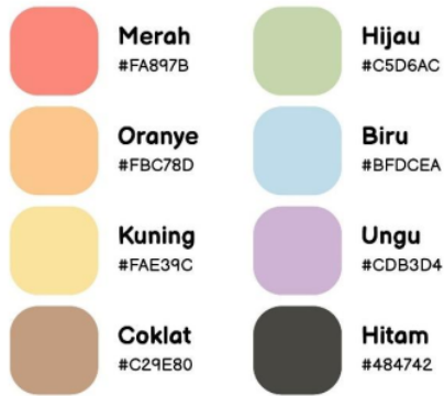
Gambar 5. Color palette