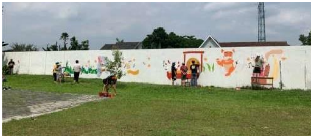
Gambar 3. Mural di tembok halaman dalam