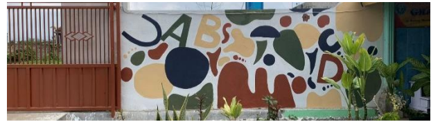
Gambar 10. Mural di tembok bagian depan dalam area sekolah.