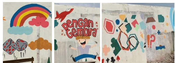
Gambar 8. Pola lukisan kolaboratif pemula yang memadukan visualisasi figur klasik dengan kontemporer.

Terciptanya suasana yang menyenangkan dan mendukung itu menghasilkan mural sebagai media pembelajaran interaktif-kolaboratif itu menjadi salah satu contoh yang pernah dilakukan oleh Dananjaya (2010: 29), mural dikatakan mampu menjadi media pembelajaran aktif adalah ketika mampu membangun suasana yang "hidup", interaktif dan menyenangkan. Mural dengan gaya yang diciptakan paramuda pria itu dimaknai sebagai menjadi bentuk media yang mampu menyampaikan edukasi menurut 'cara pandang lokal' sehingga diharapkan menjadi sesuatu yang menyenangkan karena mengikuti karakteristik sasaran. Lokal malang bagi masyarakat lokal malang.