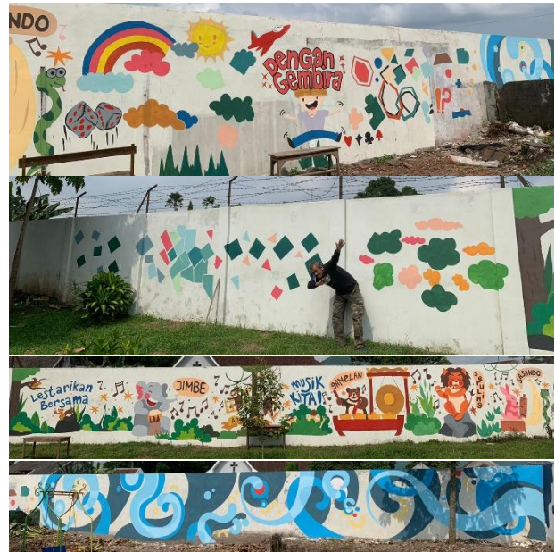
Gambar 12. Mural di tembok bagian samping dalam area sekolah.

Sedangkan bagian dalam ruangan dapat dilihat pada 4 foto pada Gambar 13, dibawah ini: