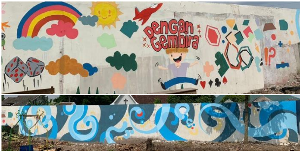
Gambar 9. Perbandingan karya mahasiswa yang berkolaborasi dengan paramuda putri (atas), karya paramuda pria GKJW (tengah) dan karya dosen DKV (bawah).

Spot tembok yang menampilkan lukisan mural karya paramuda pria itu diletakkan ditengah, diapit mural kolaborasi mahasiswa (dengan paramuda putri), dan dosen. Bidang mural yang dikerjakan paramuda pria menjadi bidang yang menyatukan antara lukisan yang ada dikiri dan kanan bidang gambar. Sebelah kiri adalah mural yang dikerjakan salah satu tim mahasiswa Prodi DKV Petra semester akhir. Mural yang disebelah kanan adalah karya salah satu dosen DKV. Nampaknya karya mural paramuda pria 'hendak menyatukan' kedua karakter mural yang dihasilkan dari dua entitas yang sama namun berbeda level. Karya paramuda itu dinilai cukup berhasil menjadi representasi yang tidak kalah menarik dibandingkan karya dikiri dan kanannya.