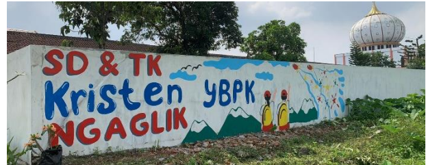
Gambar 11. Mural di tembok bagian depan luar area sekolah.