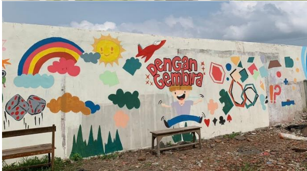
Gambar 7. Paramuda pria GKJW jemaat Sukun dan hasil karyanya.

Dari hasil lukisan paramuda pria itu terlihat bahwa mereka belum punya pengalaman dalam melukis mural. Patut diapresiasi adalah ungkapan visualisasi yang dihasilkan ternyata keluar dari elemen-elemen visual klasik yang biasa dilukis oleh pemula, seperti dua gunung yang ditengahnya ada jalan dengan sawah menghampar dikiri-kanan. Itu menjadi visualisasi-paritas. Pada mural itu visual yang menjadi paritas pemula tidak sepenuhnya terlihat. Terdapat campuran elemen visual paritas yang berbaur dengan hal-hal kreatif. Ada visual matahari di langit bersama kapal udara. (visualitas yang biasa ditemukan pada gambar pemula) muncul juga di lukisan mural itu. Bercampur sesuatu yang kreatif yang dipahami sebagai bentuk-bentuk elemen visual baru yang berbeda.