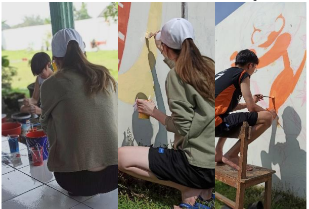
Gambar 5. Proses pengerjaan pada tembok halaman dalam sekolah di hari kedua pelaksanaan.

Proses total pengerjaan mural di TK Gracia dan SDK YBPK Ngaglik Malang dilakukan mulai siang tanggal 24 sampai 26 Juni 2022 dini hari. Pada prinsipnya itu menjadi upaya solutif atas problem pertama, yakni penciptaan keindahan yang berfungsi sebagai daya tarik lembaga pendidikan tersebut. Problem kedua terkait penciptaan kesan dan nuansa khas anak level TK dan SD. Problem ketiga adalah terkait penciptaan efektivitas dan efisiensi dalam sinergi kolaboratif, dimana seluruh mural harus selesai di hari ketiga. Oleh tim Gugus Tugas kemudian diatasi dengan penciptaan visualisasi sederhana yang tidak menyeluruh pada seluruh tembok. Visual mural hanya bidang-bidang