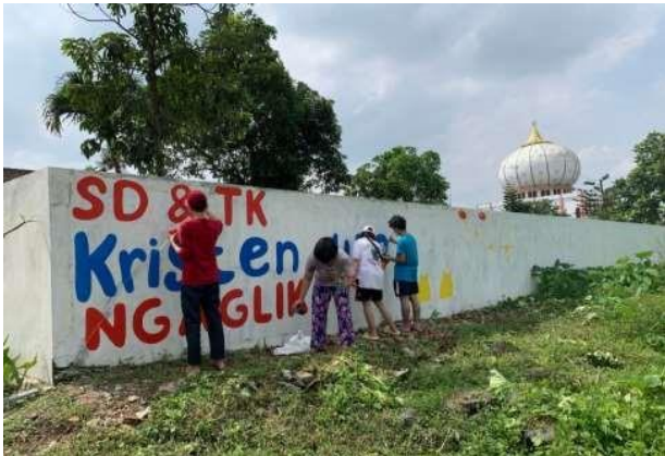
Gambar 4. Mural di tembok halaman depan luar