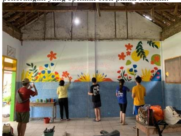
Gambar 2. Proses mural dinding di ruang kelas