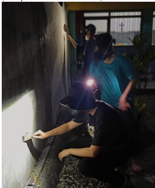
Gambar 1. Hari pertama proses pembersihan tembok dan sketsa awal. Belum disiapkan penerangan yang optimal oleh pihak sekolah.

Pengerjaan mural diawali dengan pembersihan tembok yang sebagian berjamur sehingga merusak lapisan cat dasar. Berikut dokumentasi dari pelaksanaan kegiatan itu (terdapat di foto-foto berikut ini):