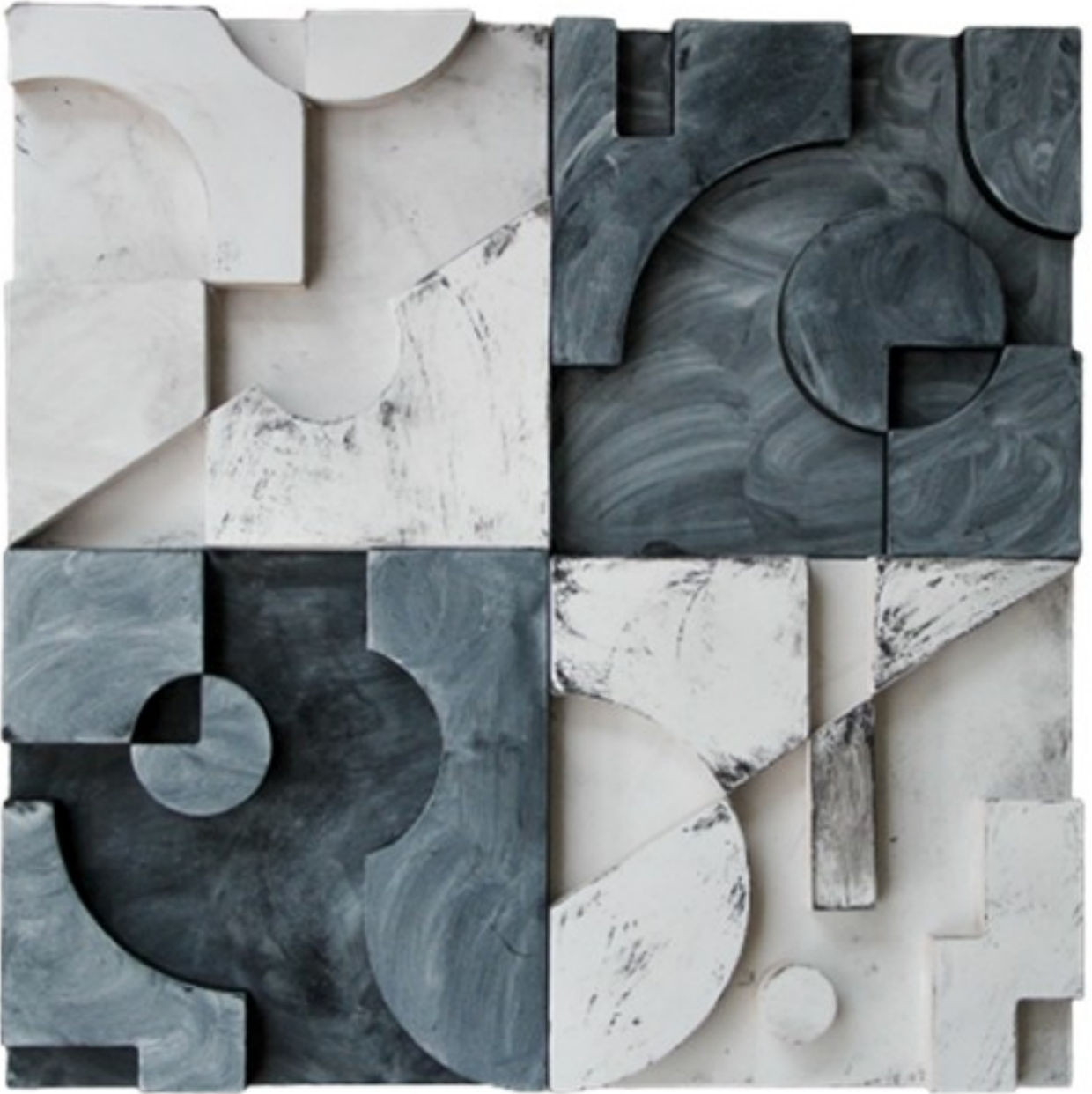
Gambar 4 - Tampak Depan