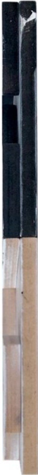
Gambar 7 - Tampak Samping Kanan