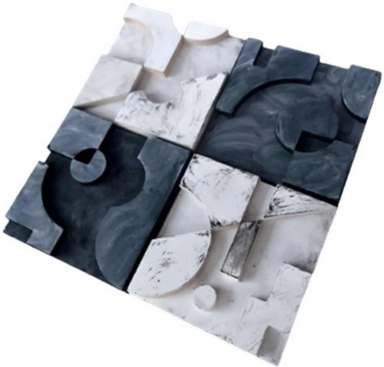
Gambar 1 - Tampak Perspektif