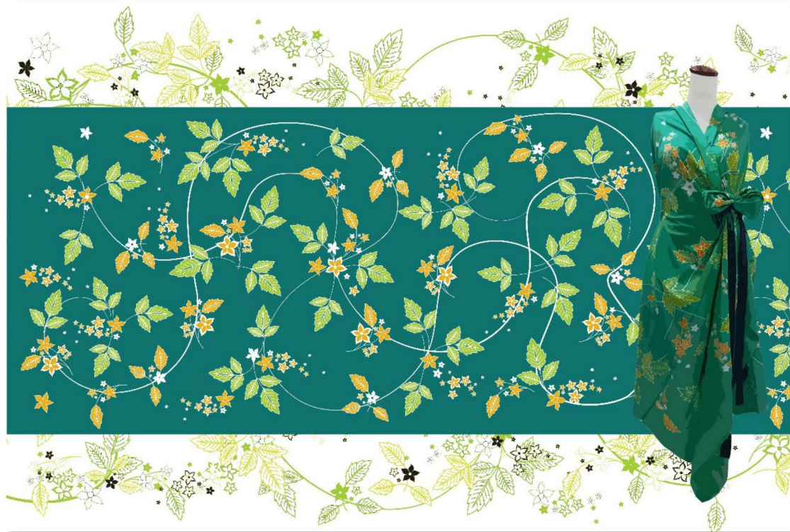
Karya asli: Desain Batik Kuningan Tegalsari