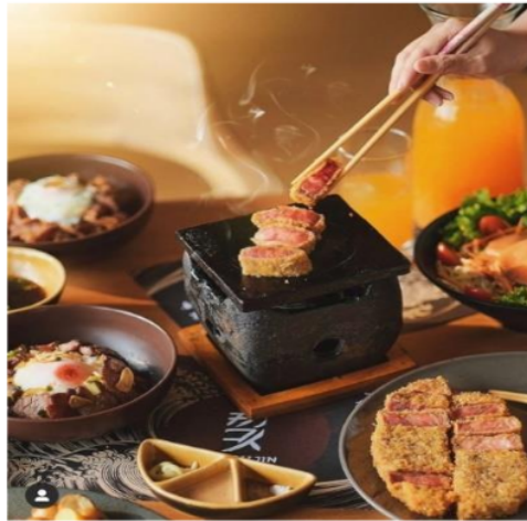
Gambar 1. Foto yang digunakan sebagai objek penelitian

Berdasarkan survei yang telah dilakukan oleh peneliti melalui Instagram polling, akun Instagram Inijie terpilih sebagai sebagai sarana dalam menentukan foto makanan yang akan digunakan sebagai objek dalam penelitian. Peneliti memilih 3 foto yang memiliki jumlah likes paling banyak selama kurun waktu 1 tahun terakhir. Tiga foto tersebut dipilih salah satu yang dianggap memiliki kompleksitas visual yang paling tinggi oleh tiga orang ahli dalam bidang fotografi, dan didapatkan 1 foto yang dipilih memiliki kompleksitas visual yang tinggi.