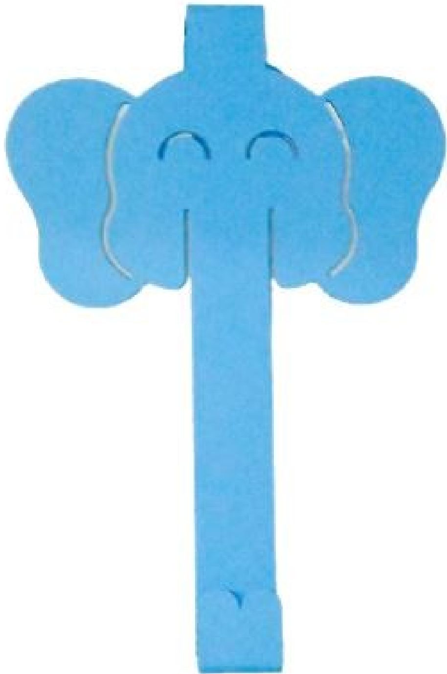
Gambar 4 - Tampak Depan