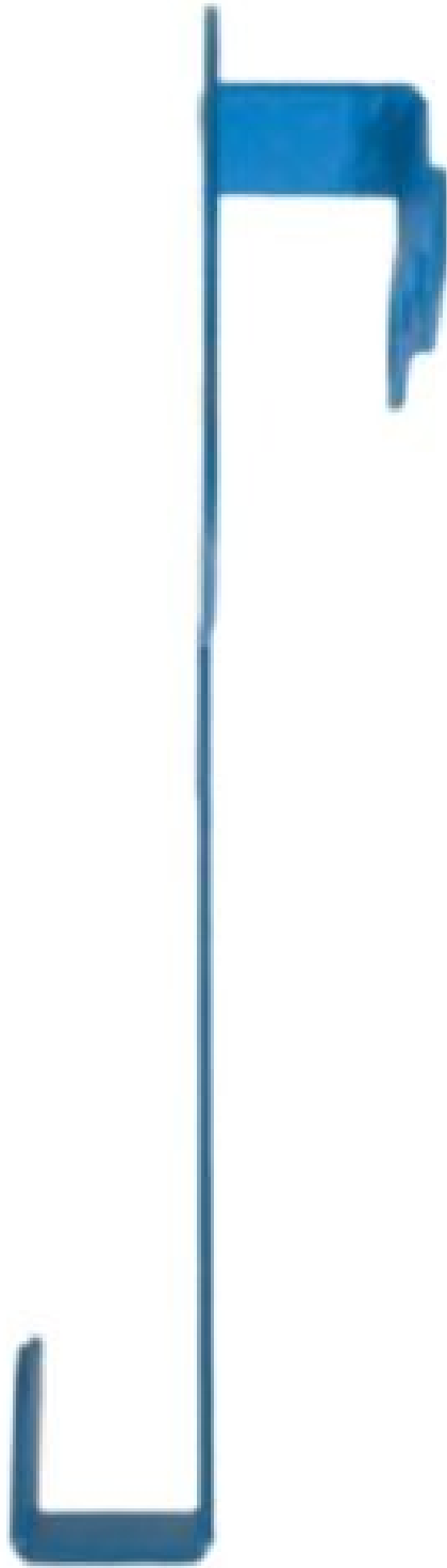
Gambar 6 - Tampak Samping Kiri