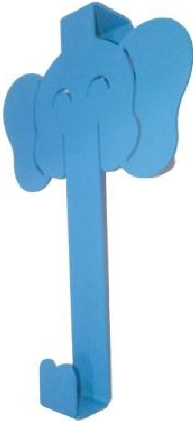
Gambar 1 - Tampak Perspektif