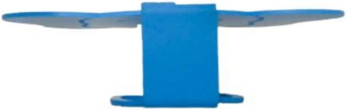
Gambar 2 - Tampak Atas