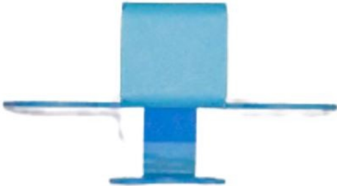
Gambar 3 - Tampak Bawah