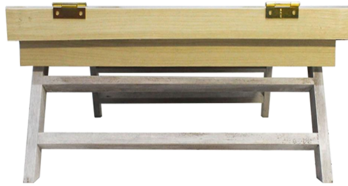
Tampak Samping Kiri