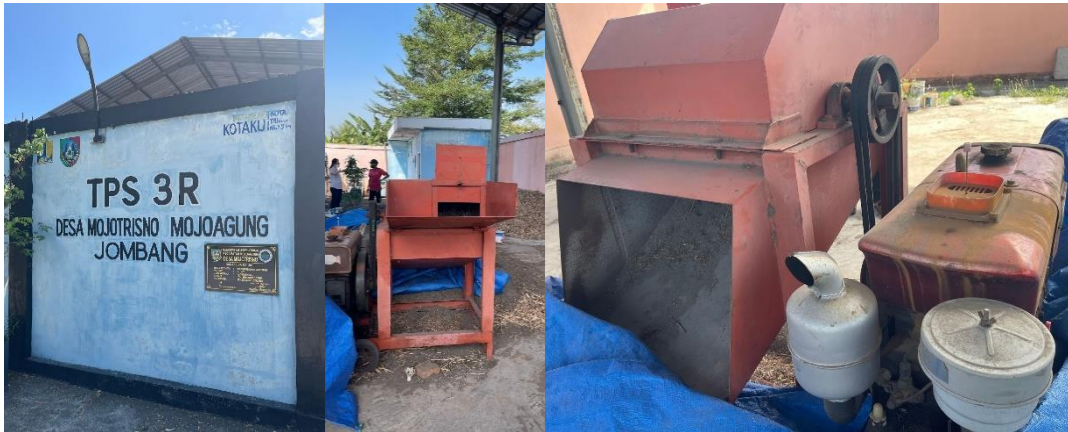
Gambar 2. Lokasi TPS 3R Desa Mojotrisno dan Mesin Pencacah Sampah

Cara kerja mesin ayakan kompos termasuk sederhana, bahan baku sampah organik yang belum didekomposisi atau hasil dekomposisi dimasukkan melalui lubang ayakan yang kecil. Mesin dinyalakan dan saringan rotari akan berputar untuk melakukan proses pengayakan, hasil yang memenuhi standar keluar dari bagian output 1 dan hasil yang tidak memenuhi standar keluar dari bagian 2. Hasil yang memenuhi standar siap untuk dimasukkan ke kantong dan ditimbang, sedangkan yang belum memenuhi standar akan dirajang ulang. Setelah proses pengayakan selesai, motor dimatikan untuk menghemat bahan bakar.