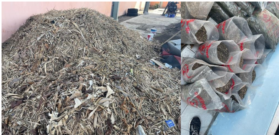
Gambar 3. Produk Sampah Sebelum dan Sesudah Diolah

Pembuatan kompos membutuhkan waktu pengolahan setidaknya 21 hari dari proses pencacahan hingga jadi kompos siap pakai. Lama proses dapat diperpendek dengan mempercepat proses decomposing , yaitu membuat hasil rajangan sebelum difermentasi lebih singkat. Hasil saringan menghasilkan pupuk kompos lebih halus dan siap digunakan. Proses pengolahan tersebut memberikan dampak positif dengan peningkatan produktivitas hasil pengolahan pupuk kompos serta peningkatan ekonomi melalui pelatihan manajemen keuangan terkait penjualan pupuk kompos.