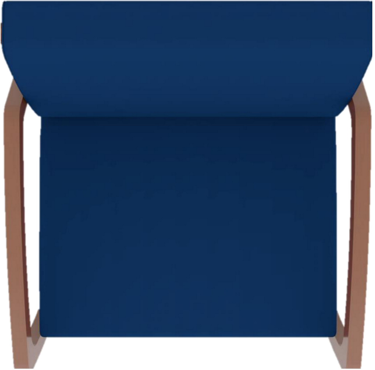
Gambar 2 - Tampak Atas