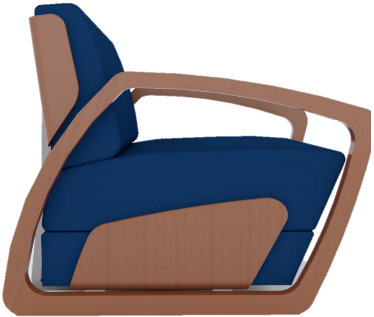
Gambar 6 - Tampak Samping Kiri