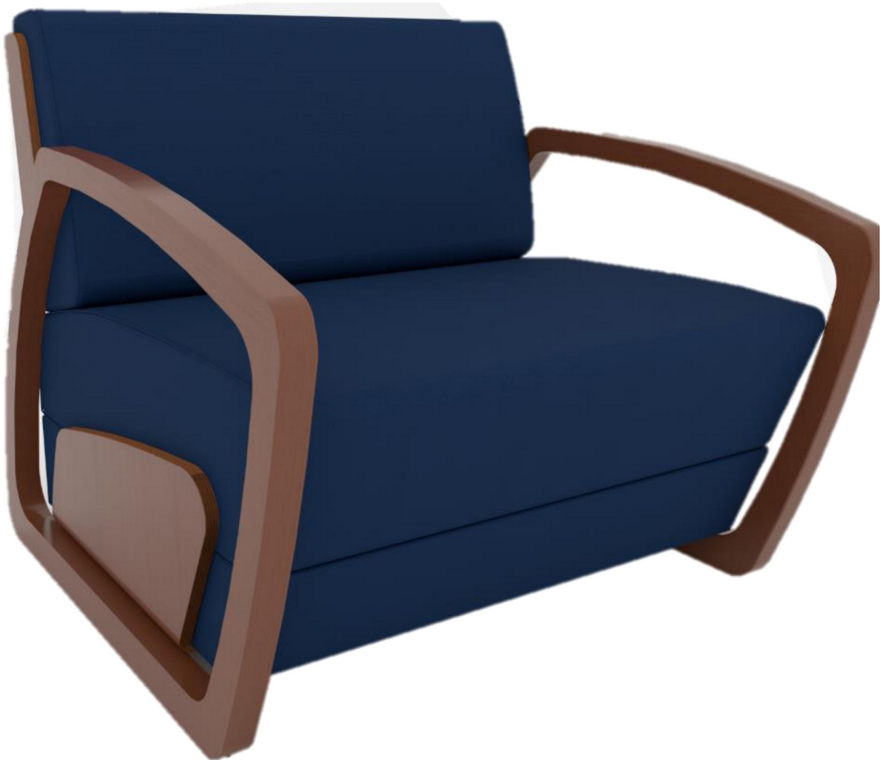
Gambar 1 - Tampak Perspektif