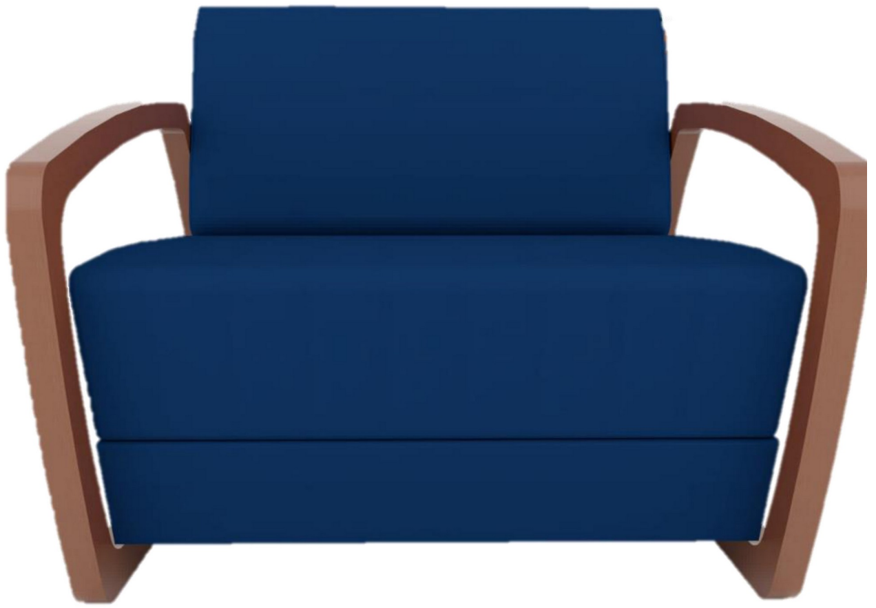
Gambar 4 - Tampak Depan