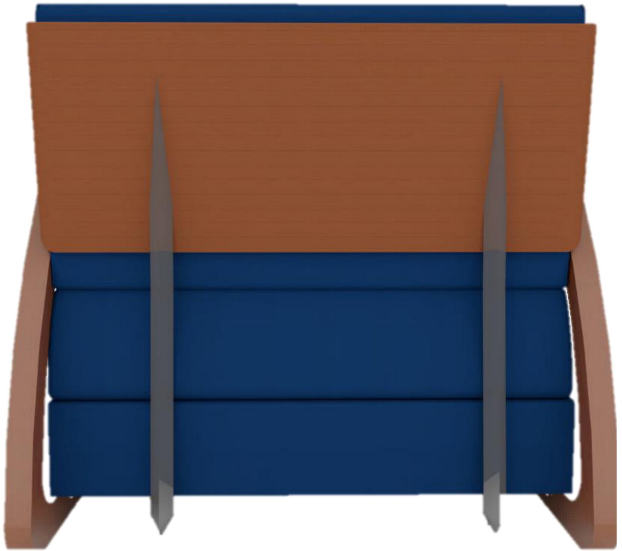
Gambar 5 - Tampak Belakang