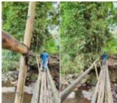
Gambar 10. Kondisi eksisting jembatan

Mahasiswa mendampingi mitra untuk membuat desain jembatan bambu yang secara konstruksi mudah dibangun, namun memiliki nilai estetika yang menarik.