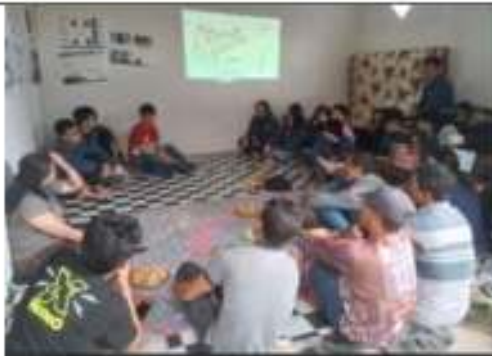
Gambar 4. Foto kegiatan public hearing 2

Setelah public hearing kedua dilaksanakan, Pengabdian dan para mahasiswa sama-sama menjalani rute track kembali, untuk memastikan kondisi track, memastikan keterbongunan desain yang telah dipilih melalui pengukuran yang lebih akurat pada site dan track.