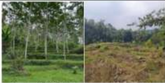
Gambar 9. Kiri: Hutan sengon, Kanan: ladang