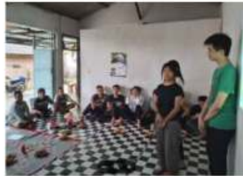
Gambar 4. Foto kegiatan Public Hearing 1

merumuskan rute wisata lintas desa, menetapkan perletakan gazebo, mendesain jembatan. Gambar dan desain yang dihasilkan dipresentasikan kepada Perangkat Desa dan Kelompok Sadar Wisata untuk didiskusikan dan diberi masukan – masukan dari Masyarakat desa, untuk selanjutnya dapat dibawa pada tahap pengembangan desain ( public hearing ). Gambar 4, adalah foto pelaksanaan public hearing pertama.