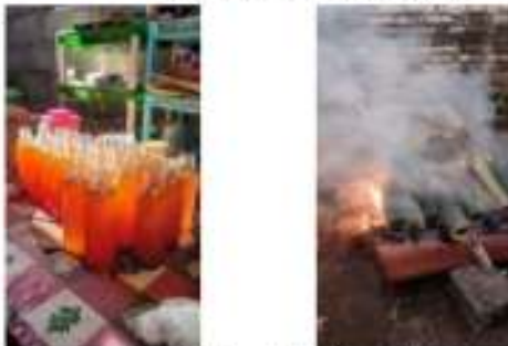
(b) Kuliner khas Desa Jarak