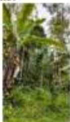
Gambar 6. Kondisi rute track Panjang

Selanjutnya, survei track pendek dilakukan bersama mahasiswa. Pada survei ini, reaksi mahasiswa, yang sebagian besar belum pernah melakukan trekking juga menjadi umpan balik dalam penentuan rute.