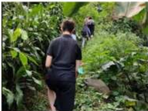
Gambar 3, Foto kegiatan survey lintasan

Survei rute trekking ini dilaksanakan dua kali, untuk mempertimbangkan keberagaman wisatawan yang akan mengikuti rute. Dari hasil survey bersama, mahasiswa akan membantu