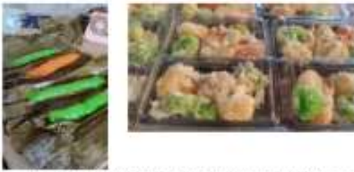
(a) Kemasan awal dan kemasan masukan yang lebih mudah untuk dibawa