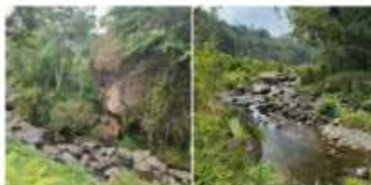
Gambar 8. Kiri: Watu lumbung, Kanan: Sungai

Dalam perjalanannya wisatawan akan menemui beberapa pemandangan yang berbeda-beda. Seperti yang dapat dilihat di Gambar 8-kiri, Ada batu besar yang oleh masyarakat lokal diberi nama Watu Lumbung (Batu Lumbung). Setelah itu wisatawan akan menyusuri tepian sungai (gambar 7-kanan). Kemudian gambar 9. Menunjukkan rute selanjutnya yaitu area hutan sengon, yang kemudian perjalanan akan melewati hamparan ladang terbuka, hingga pada suatu titik wisatawan akan diajak melintasi sungai dengan meniti jembatan bambu. Jembatan inilah yang akan didesain ulang agar tampak lebih estetis dan instagramable . Berikut adalah foto beragam pemandangan yang dapat dinikmati pada rute wisata lintas desa.