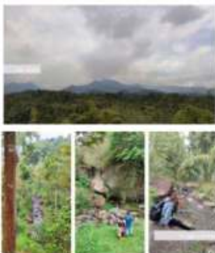
Gambar 1. Pemandangan alam Desa Jarak

Di lain pihak, Desa Jarak merupakan sebuah desa di kaki Gunung Anjasmoro, Kecamatan Wonosalam, Kabupaten Jombang. Desa Jarak merupakan desa yang subur, sejuk dan memiliki pemandangan yang indah: lembah hijau, harumnya bunga kopi yang sedang mekar, air terjun dan sungai yang bening. Lokasi Desa Jarak berada di kaki Gunung Anjasmoro, tepatnya 482 m dari permukaan laut, sehingga suhu cenderung sejuk, berkisar antara 25-28 0 C. Desa ini memiliki segudang potensi, utamanya adalah lokasinya yang diantara bukit – bukit, pemandangan alam indah yang masih asli, penduduk yang ramah dan aktivitas pariwisata camping ground serta paket wisata lintas desa ( trekking ) yang sudah ada namun kurang terbina.