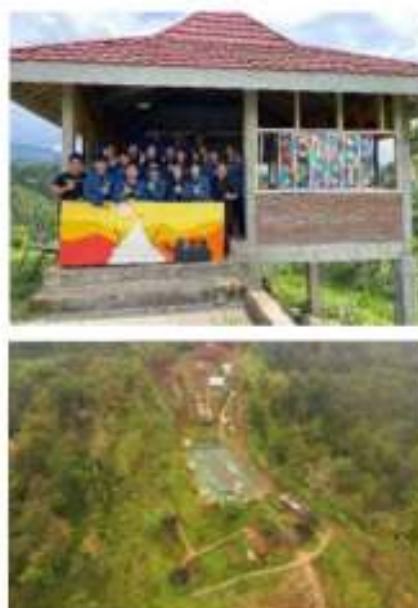
Gambar 2. Pengembangan fasilitas camping di Bukit Pecarigan yang telah dilakukan sebelumnya

komunitas. Beberapa kegiatan yang terjadi adalah acara camping dari komunitas mobil seperti: Mobil IGNIS, Mobil Mazda, Mobil Carry, acara outbond dan persami oleh murid-murid sekolah, dan berbagai aktivitas lain yang mengundang minat masyarakat dari luar Wonosalam untuk berkunjung ke tempat ini. Namun seperti yang diungkapkan oleh Audyarizki, 2022, bahwa kegiatan wisata di Bukit Pecarigan masih perlu dikembangkan. Salah satu hal yang dapat dikembangkan adalah pengkayaan aktivitas, untuk mengisi waktu selama camping dilaksanakan, hingga dari waktu ke waktu, para pengunjung memiliki pilihan kegiatan, selain bersantai dan menikmati pemandangan yang cantik dari atas bukit.