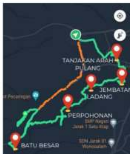
Gambar 7. Rute wisata lintas desa

Berdasarkan survey bersama oleh pengabdian, mahasiswa dan anggota kelompok sadar wisata didapatkan rute sebagai yang terlihat di gambar 7. Rute berawal dari Bukit Pecaringan, memasuki jalan setapak, menuruni tebing (jalur hijau), menyusuri Sungai, mendaki tebing, Kembali ke pecaringan (jalur orange).