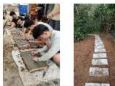
(b) Perbaikan Perkerasan