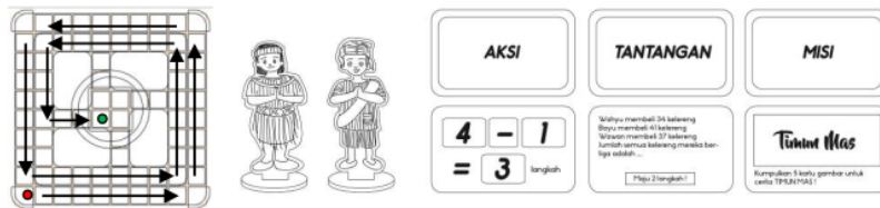
Gambar 3. Sketsa Digital Papan Permainan, Pion, Kartu Kasi, Kartu Tantangan, dan Kartu Misi

Board game edukatif ini dirancang untuk khalayak sasaran, yaitu anak binaan Komunitas Pecinta Anak Jalanan Makassar, usia sekolah dasar (6-12 tahun). Berdasarkan hasil wawancara dan studi pustaka yang telah dilakukan, penulis akan merancang board game edukatif ini sebagai media pembelajaran untuk memudahkan anak binaan dalam memahami pelajaran matematika dengan media dan metode yang interaktif dan menyenangkan. Jenis board game yang digunakan dalam perancangan ini adalah card-based strategy games , di mana setiap pemain harus menyelesaikan soal matematika untuk mengumpulkan kartu gambar dan mencapai finish . Dengan adanya misi yang harus diselesaikan dalam permainan, diharapkan dapat menumbuhkan sikap pantang menyerah dari pemain. Pemain juga menjadi semakin tertantang untuk menyelesaikan soal-soal matematika, yang diharapkan dapat meningkatkan kemampuan berhitung.