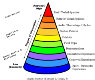
12 Gambar 2. Dale's Cone of Experience

Menurut Riyana (2012), ada beberapa komponen-komponen yang saling berkaitan dalam sistem pembelajaran untuk mencapai tujuan pembelajaran, yaitu tujuan, materi, metode, media, dan evaluasi. Pembelajaran sendiri merupakan proses komunikasi antara guru, peserta didik, dan bahan ajar. Untuk menjalankan komunikasi yang baik, diperlukan sarana penyampai pesan atau media. Dapat disimpulkan bahwa media pembelajaran adalah segala sesuatu yang dapat digunakan untuk menyalurkan pesan (bahan pembelajaran) agar dapat merangsang perhatian, minat, pikiran, dan perasaan peserta didik dalam kegiatan belajar (Nurdyansyah, 2019).