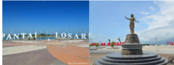
Gambar 4. Referensi Visual: Pantai Losari dan Tugu di Anjungan Toraja

cerita. Papan permainan dalam board game ini dirancang menyerupai classic board game yang lebih sederhana dengan petak-petak berbentuk rounded rectangle agar alur permainannya lebih jelas dan mudah dipahami. Dadu dalam permainan ini digunakan untuk menentukan kartu aksi atau kartu tantangan yang berisi soal yang harus dikerjakan agar dapat menjalankan pion.