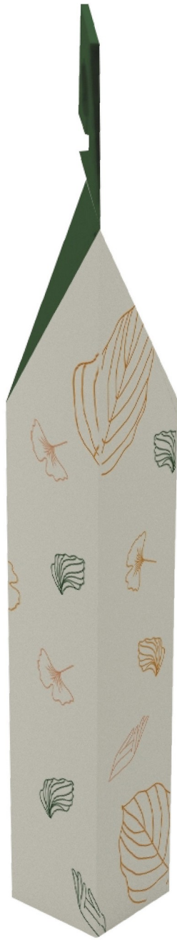
Gambar 7 - Tampak Samping Kanan