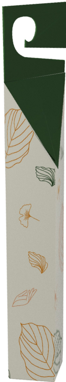
Gambar 5 - Tampak Belakang