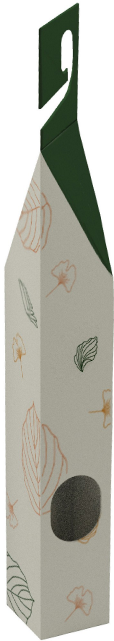
Gambar 6 - Tampak Samping Kiri