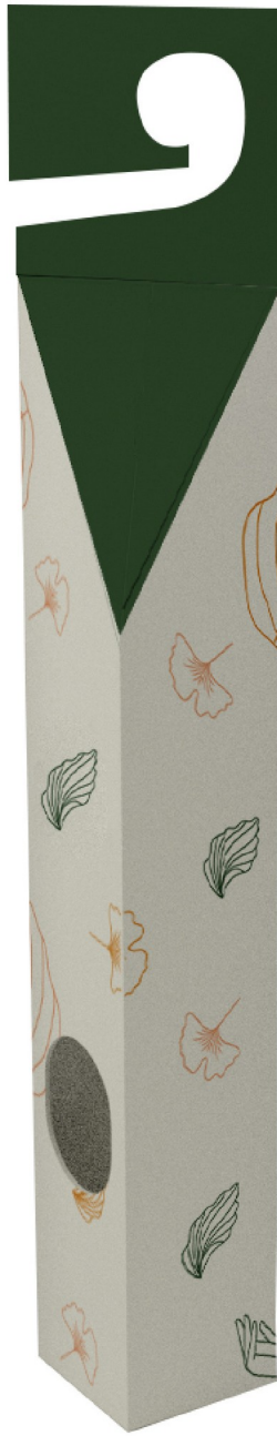
Gambar 4 - Tampak Depan