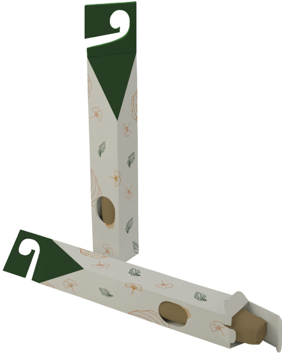
Gambar 1 - Tampak Perspektif