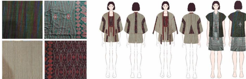
Gambar 3. Material tenun dan desain

dikembangkan produk ke arah tidak saja menjadi produk dengan harga menengah tetapi juga membuat produk dengan harga premium sehingga bisa dinikmati dari berbagai kalangan mengingat bahan tenun ATBM terhitung sulit dan lama dalam pembuatannya. Pengunjung dari usia muda berpendapat busana yang dihasilkan cocok untuk kawula muda karena terlihat modern meskipun terdapat unsur wastra tenun. Justru wastra yang menjadi bagian utama dari busana terkesan kekinian dan hal tersebut sesuai dengan minat mereka. Respon ini secara khusus diberikan untuk model desain ketiga.