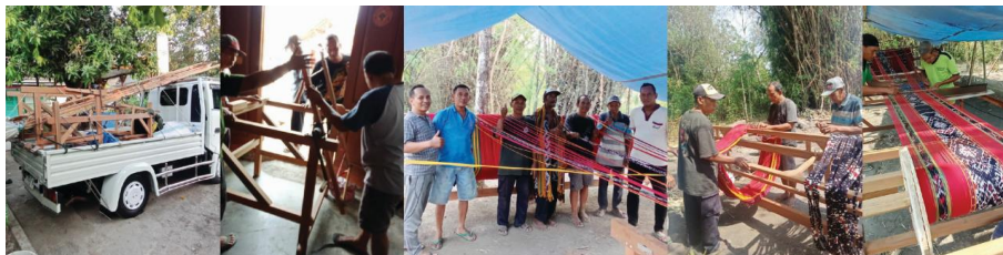
Gambar 8. Perakitan dan penataan benang lusi

Untuk peningkatan kapasitas produksi PKM juga telah mendukung Pokmas Wastra Sejahtera dengan memberikan mesin alat khusus untuk mengintervensi pemanfaatan benang lusi sebagai benang yang akan dikembangkan secara motif maupun ukuran kain. Tenun yang dihasilkan akan disebut tenun ikat lusi yang desainnya tercipta karena kumpulan benang lusi yang dibentangkan pada alat perentang (dalam proses pemedangan), kemudian diikat dengan tali rafia sesuai desain motif dan warna yang dikehendaki, sebelum akhirnya dicelup dalam warna (Wijayanti, 2013). Selama ini alat yang tersedia lebih untuk produk tenun pakan dimana desain motif dihasilkan dengan ikatan dan gambar pada benang pakan dan hasil tenunnya berukuran pendek dan tidak cukup fleksibel dalam pemanfaatannya. Dengan alat yang baru memungkinkan produksi tenun untuk sandang maupun non sandang. Berikut foto perakitan dan penataan benang lusi.