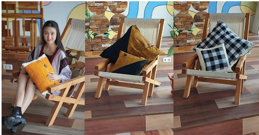
Gambar 7. Bantal elemen interior

Untuk peningkatan kapasitas produksi PKM juga telah mendukung Pokmas Wastra Sejahtera dengan memberikan mesin alat khusus untuk mengintervensi pemanfaatan benang lusi sebagai benang yang akan dikembangkan secara motif maupun ukuran kain. Tenun yang dihasilkan akan disebut tenun ikat lusi yang desainnya tercipta karena kumpulan benang lusi yang dibentangkan pada alat perentang (dalam proses pemedangan), kemudian diikat dengan tali rafia sesuai desain motif dan warna yang dikehendaki, sebelum akhirnya dicelup dalam warna (Wijayanti, 2013). Selama ini alat yang tersedia lebih untuk produk tenun pakan dimana desain motif dihasilkan dengan ikatan dan gambar pada benang pakan dan hasil tenunnya berukuran pendek dan tidak cukup fleksibel dalam pemanfaatannya. Dengan alat yang baru memungkinkan produksi tenun untuk sandang maupun non sandang. Berikut foto perakitan dan penataan benang lusi.