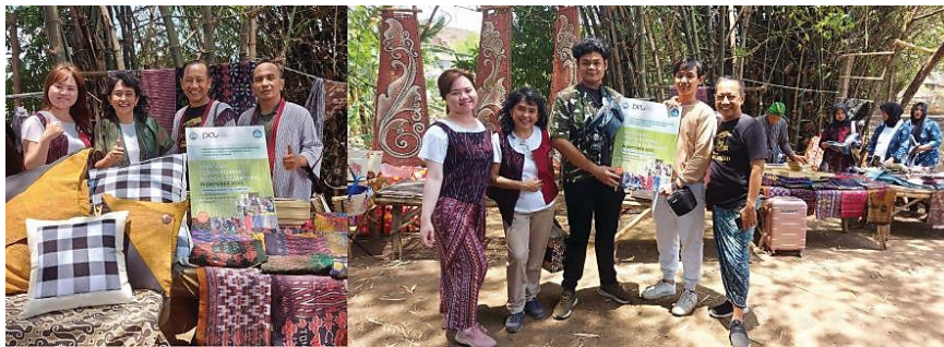
Gambar 5. Pameran produk PKM di Pasar Barongan

Saran kedepannya, untuk produk dapat di- branding agar tenun dan produknya dapat dikenal lebih luas. Seorang pengunjung lain menyarankan untuk secara total menggunakan wastra tenun ATBM. Artinya tidak mencampur dengan kain hasil pabrik pada umumnya karena hal tersebut akan meningkatkan nilai jual produk. Beberapa pengunjung menanyakan harga jual, namun karena produk belum dijual tim justru menanyakan kewajaran harga untuk busana yang dibuat. Pengunjung menganggap harga sekitar Rp. 750.000,- untuk sebuah outer adalah wajar.