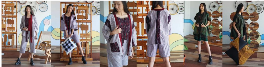
Gambar 4. Prototipe