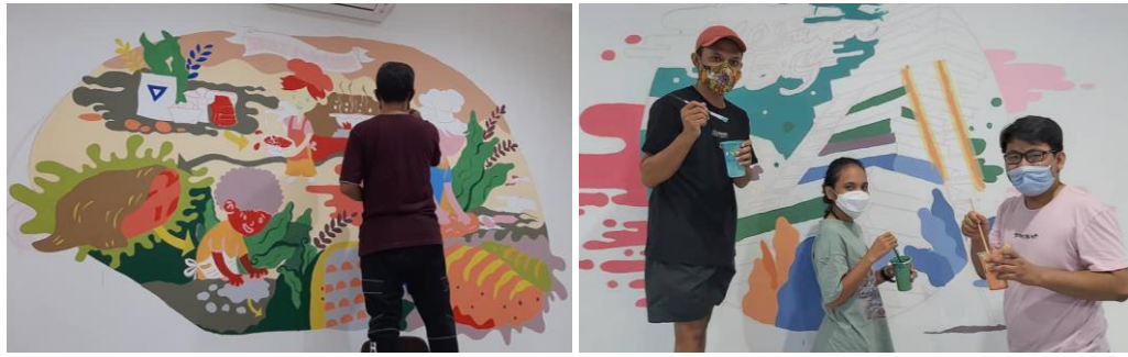
Gambar 6. Remaja dan kelompok dewasa muda, GKI Jemursari ikut serta dalam Abdimas Giat Mural.