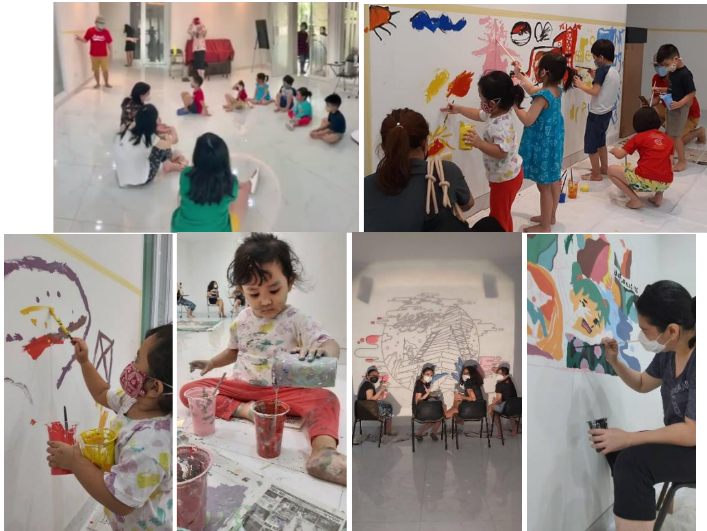
Gambar 3. Antusias warga GKI Jemursati dari majelis sampai warga gereja. Balita, remaja, dewasa sampai alumni DKV UK Petra angkatan 2006 semua melukis mural.

Hari Sabtu 8 Mei 2021 itu menjadi hari seru yang penuh kelucuan tingkah anak-anak. Wajah dan rambut yang penuh cat. Senyum gembira orang tua semburat di balik masker yang dikenakan tatkala melihat antusias anak-anaknya. Mereka layak bersukacita setelah setahun lebih terpenjarakan oleh pandemi.