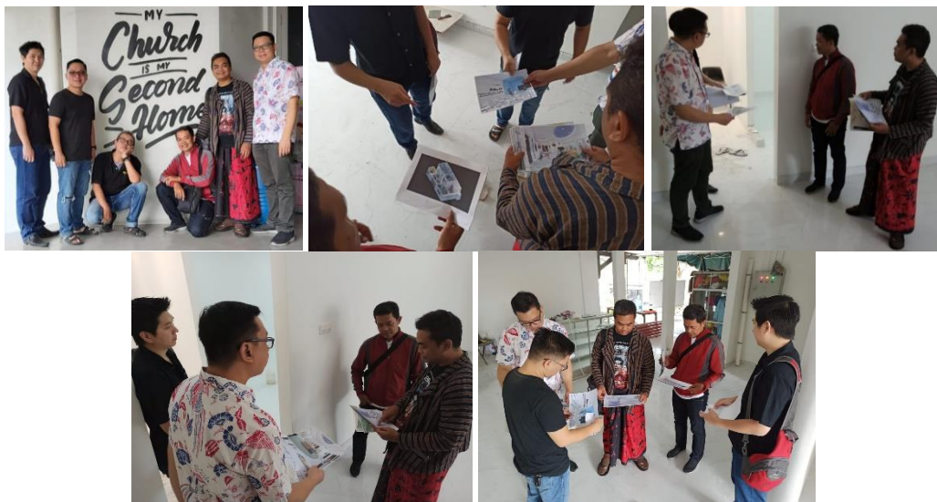
Gambar 2. Dokumentasi saat survey dan pengukuran bidang mural oleh 4 dosen DKV bersama Pendeta dan wakil Majelis Gereja, pada 9 Februari 2020.

Empat dosen DKV yang akan melakukan Abdimas mural melakukan survey lokasi. Bertemu dengan gembala jemaat dan pengurus GKI Jemursari Surabaya. Dilakukan persiapan aktivitas yakni, survey dan pengukuran bidang guna estimasi jumlah cat serta jumlah mahasiswa yang terlibat, mengingat luas bidang garapan dengan waktu yang sangat terbatas. Pada pertemuan itu didiskusikan perihal akomodasi dan penyediaan konsumsi, sketsa dan desain gambar yang akan dibuat. Semua itu dilakukan pada Februari 2020, namun tiba-tiba Pandemi Covid 19 datang, dan semua dibatalkan sampai batas waktu yang tidak ditentukan. Pandemi tidak menyurutkan semangat GKI Jemursari dan Prodi DKV, mereka tetap antusias saling berkoordinasi sembari menunggu kondisi memungkinkan.