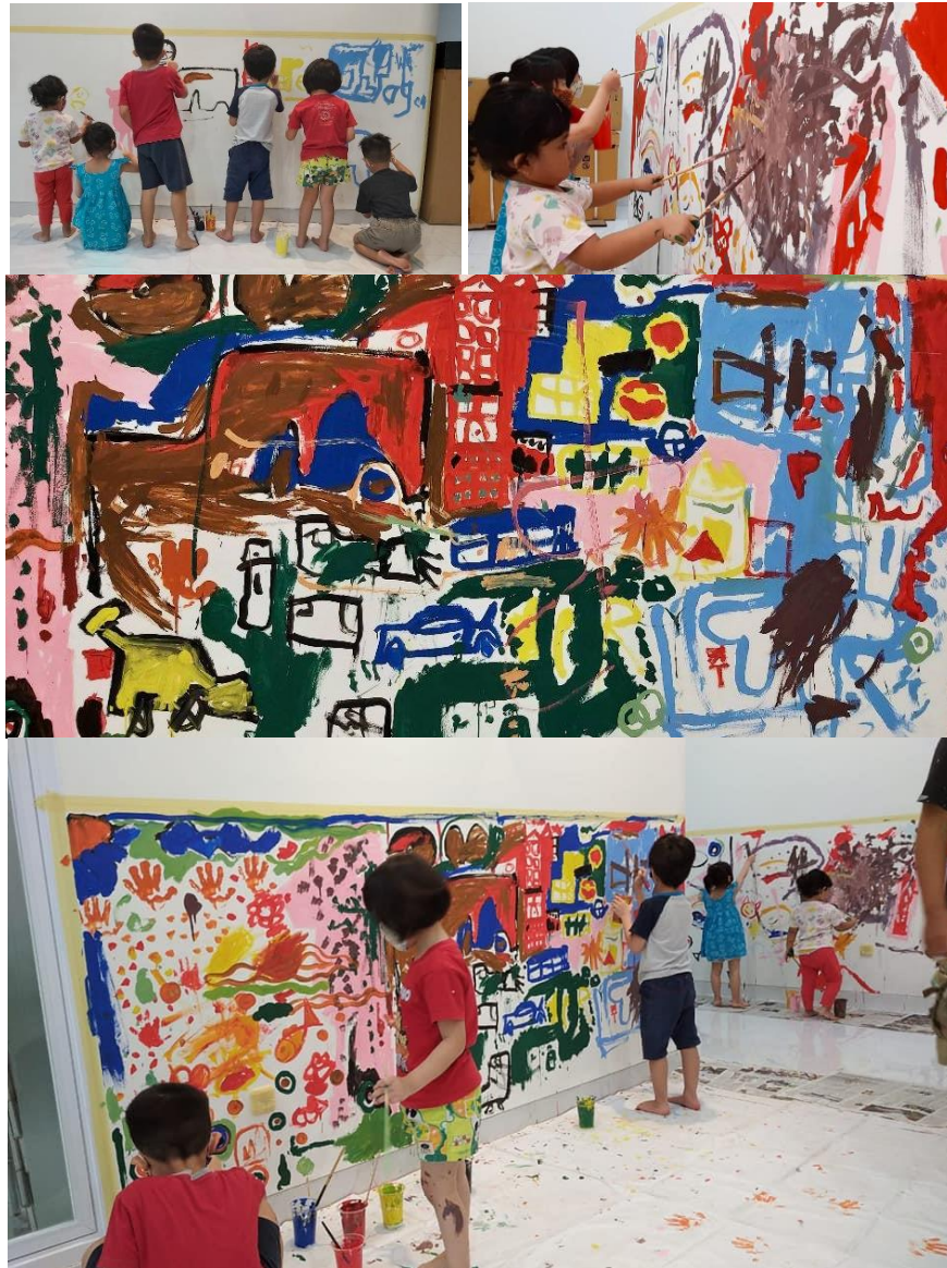
Gambar 5. Spot yang mendadak ditambah karena antusias anak-anak dan balita untuk ikut melukis mural dalam Abdimas Giat Mural itu.

Ilustrasi realis-dekoratif yang memvisualisasikan representasi tematik terdapat di 5 ruang Kelas Nazareth, Kelas Bethlehem, Kelas Kana, Kelas Yudea dan Kelas Kapernaum, sebagaimana terdapat dalam dokumentasi di bawah ini: