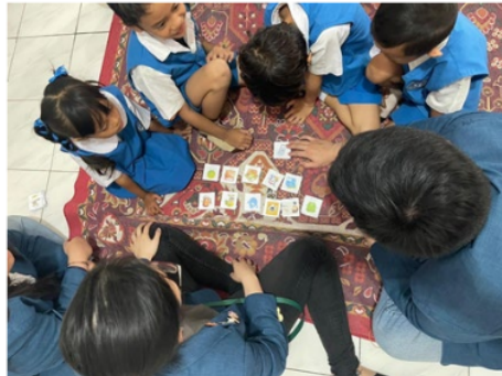
Gambar 4 Kegiatan tebak gambar

Kartu akan disusun di tengah karpet dan anak-anak akan duduk secara melingkar dengan mengelilingi gambar-gambar tersebut. Anak-anak nantinya ditunjukkan gambar berbagai kebutuhan, lalu diminta menebak dan menceritakan pengalaman mereka mengenai gambar yang dipilih. Kegiatan ini bertujuan untuk memperkenalkan kebutuhan kepada setiap anak sejak dini agar dapat mengidentifikasi jenis kebutuhan keluarga dan memahami tingkat masing-masing kebutuhan. Melalui cerita pengalaman masing-masing anak maka diharapkan timbulnya kepekaan terhadap adanya kebutuhan dalam keluarga dan bagaimana cara pengelolaan kebutuhan sehingga dapat menggunakannya secara optimal.