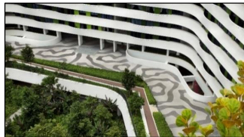
Gambar 7. Jalur sirkulasi linier di Punggol Waterway Terraces yang mengelilingi taman di lantai dasar

Kemudian untuk aspek universal design , Punggol Waterway Terraces menyediakan 6 lift (dalam 3 lift utama) yang memudahkan penghuni untuk naik dan turun, terutama bagi penyandang disabilitas dan lansia. Namun untuk koridor apartemen memiliki lebar yang sempit sehingga apabila 2 orang bertemu dari arah yang berlawanan akan terasa tidak nyaman, terlebih pengguna kursi roda (Reuben, 2021; Stacked Homes, 2021). Untuk memudahkan wayfinding para penghuni, terdapat pewarnaan berbeda pada lift yang ada di setiap blok. Dalam sebuah masa bangunan, minimal terdapat tiga lift utama yang melayani sebagian lantai Punggol Waterway Terraces (Reuben, 2021). Gambar 7 dan Gambar 8 berikut ini adalah orientasi Punggol Waterway Terraces dan beberapa jalur sirkulasinya.