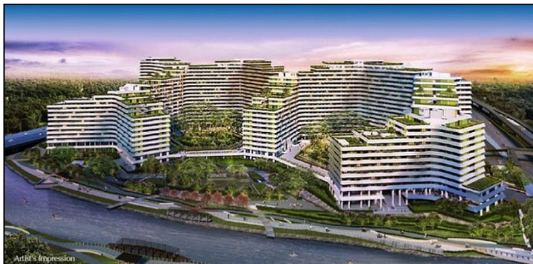
Gambar 5. Perspektif Punggol Waterway Terraces