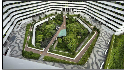
Gambar 6. Orientasi Punggol Waterway Terraces yang terpusat pada taman di lantai dasar

Pada bagian tengah kompleks ini terdapat area bermain anak. Pada lantai 9 di apartemen ini terdapat taman atap ( roof garden ) dan berfungsi sebagai tempat retensi air hujan (Castro, 2016; Reuben, 2021).