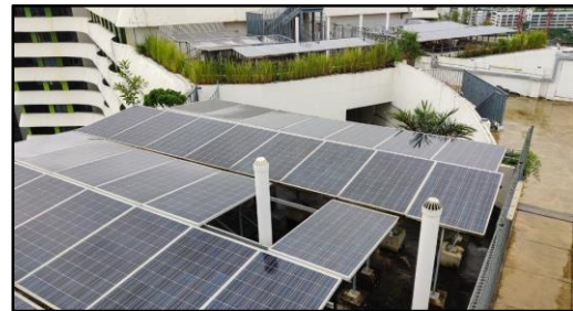
Gambar 11. Panel surya di atap Punggol Waterway Terraces untuk mendukung penerangan dan daya layanan publik di apartemen

Watt hour (GWh) energi bersih per tahun (Standen & Medina, 2022). Energi dari panel surya ini (Gambar 11) telah digunakan di Punggol Waterway Terraces untuk menyalakan layanan umum, seperti pompa air, lampu, dan elevator (Reuben, 2021). Pencahayaan dengan Smart LED diterapkan ke area umum di apartemen HDB. Inisiatif pencahayaan pintar ini menggunakan sensor gerak untuk menyesuaikan tingkat penerangan koridor. HDB juga akan menggunakan solusi ini untuk tempat parkir mobil, tangga, taman bermain, koridor umum dan jalan penghubung (Standen & Medina, 2022).