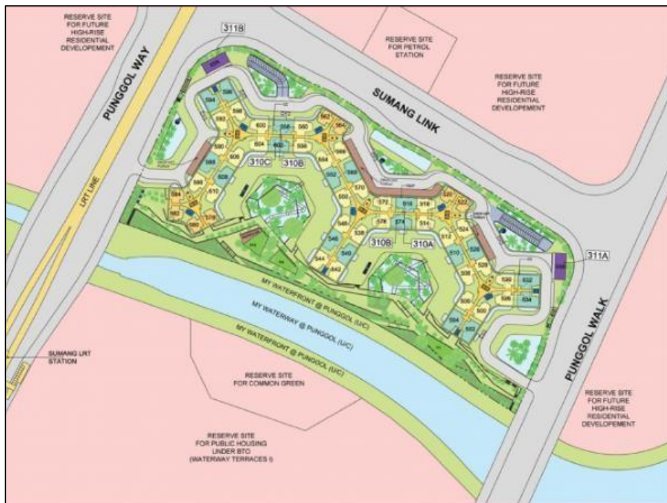
Gambar 3. Rencana Tata Letak Punggol Waterway Terraces 2