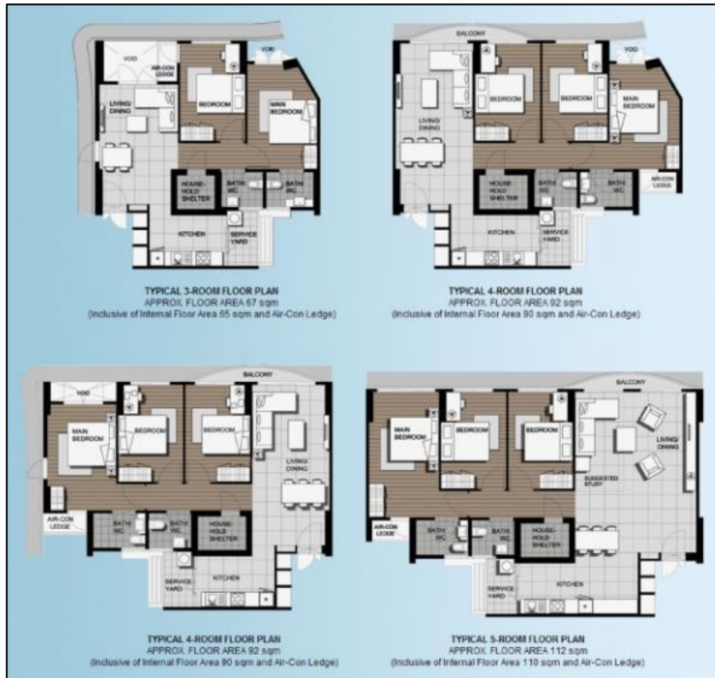
Gambar 4. Denah Unit Punggol Waterway Terraces 2