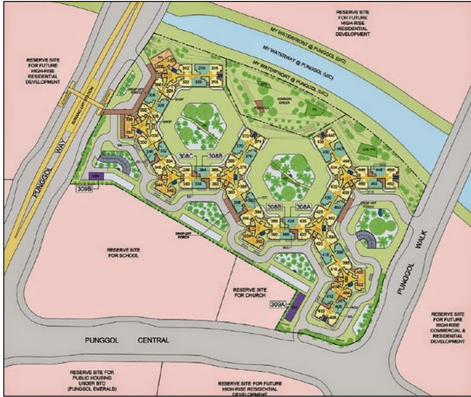
Gambar 2. Rencana Tata Letak Punggol Waterway Terraces 1