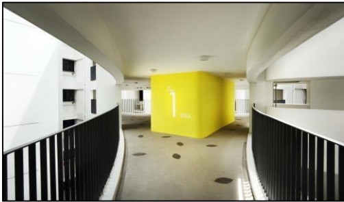
Gambar 8. Jalur sirkulasi linier di Punggol Waterway Terraces yang mengelilingi ruang bersama di lantai dasar yang terlalu panjang dan menyebabkan kurangnya privasi

Sayangnya beberapa data tidak tersedia secara detail dan beberapa sub-aspek ini tidak dibahas yaitu: