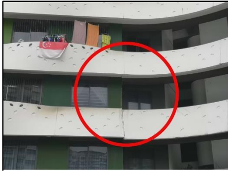
Gambar 10. Keretakan pada sambungan beberapa panel fasad di Punggol Waterway Terraces