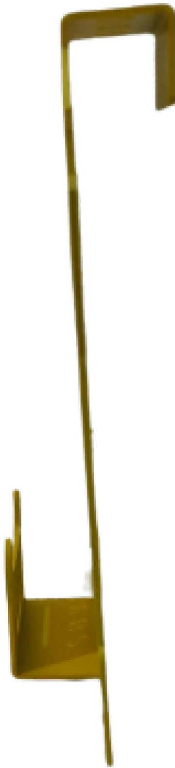
Gambar 7 - Tampak Samping Kanan