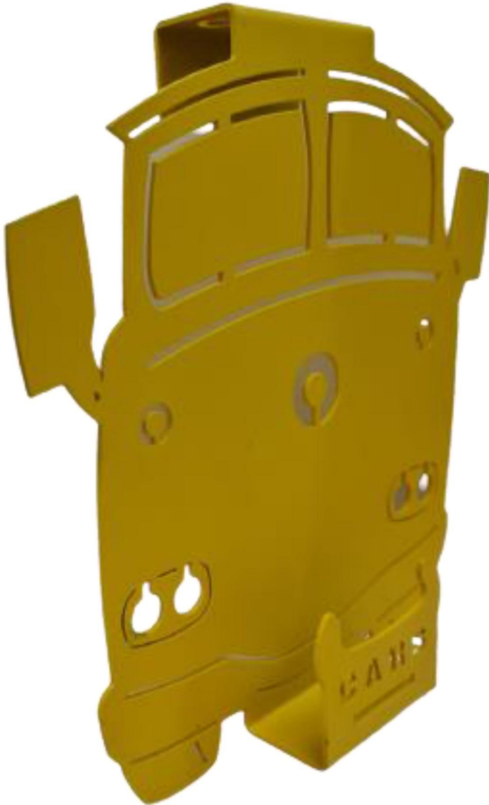
Gambar 1 - Tampak Perspektif