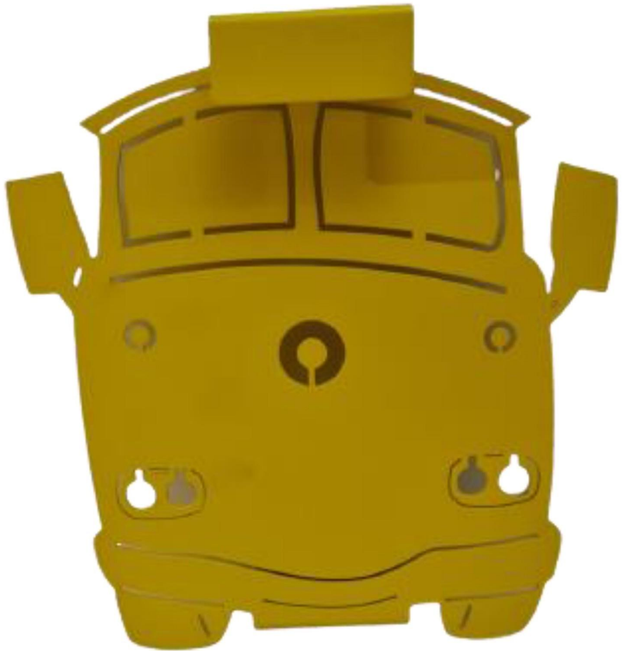
Gambar 5 - Tampak Belakang