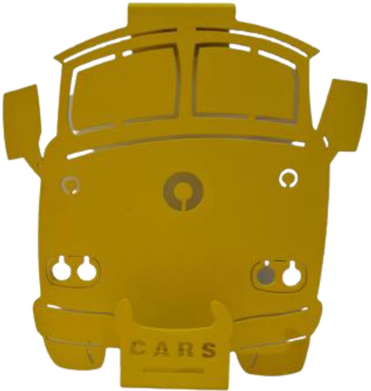
Gambar 4 - Tampak Depan