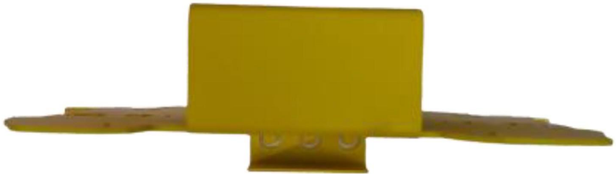
Gambar 3 - Tampak Bawah