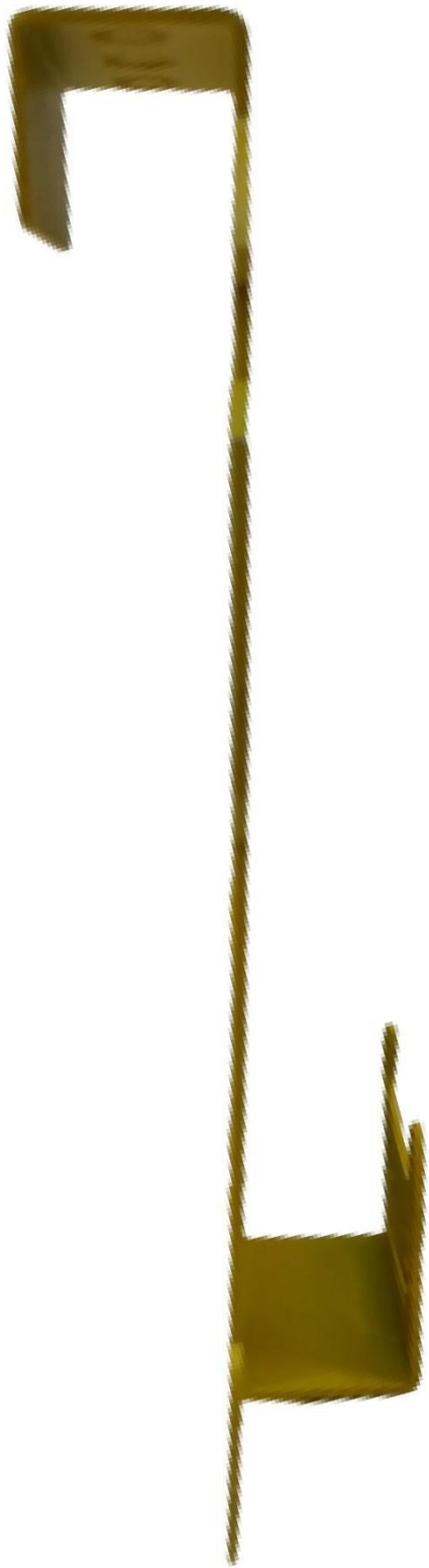
Gambar 6 - Tampak Samping Kiri