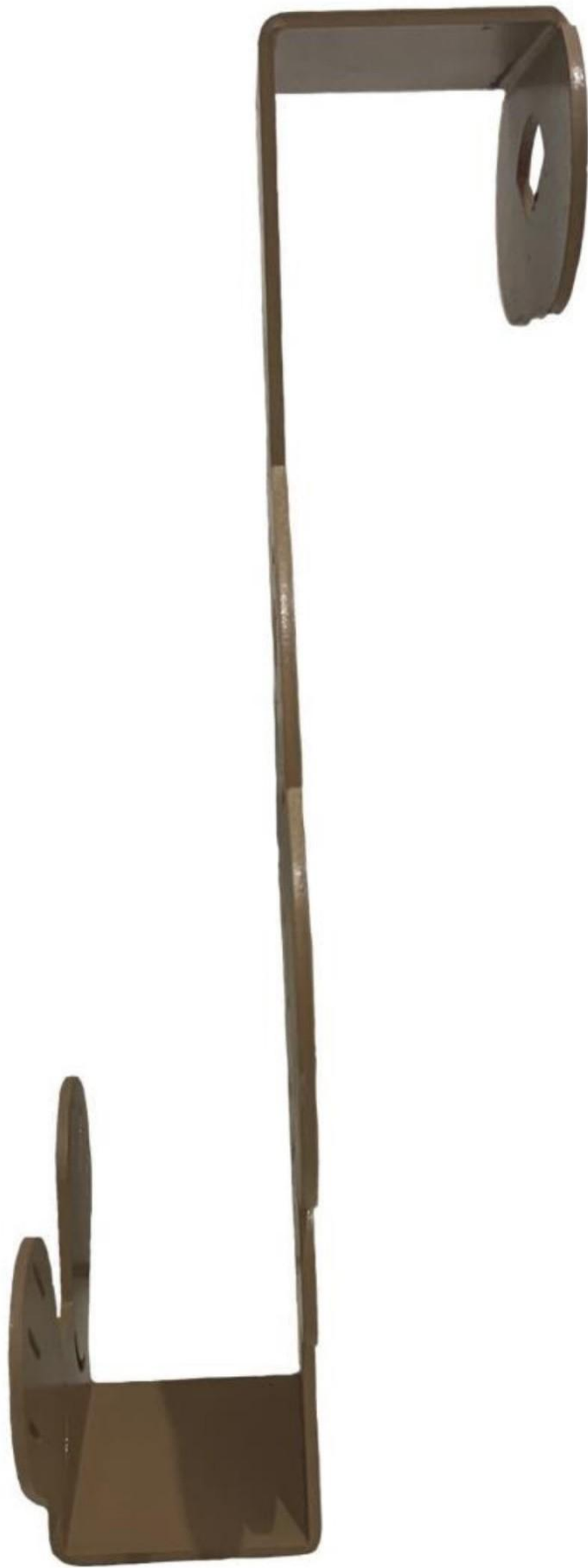
Gambar 7 - Tampak Samping Kanan