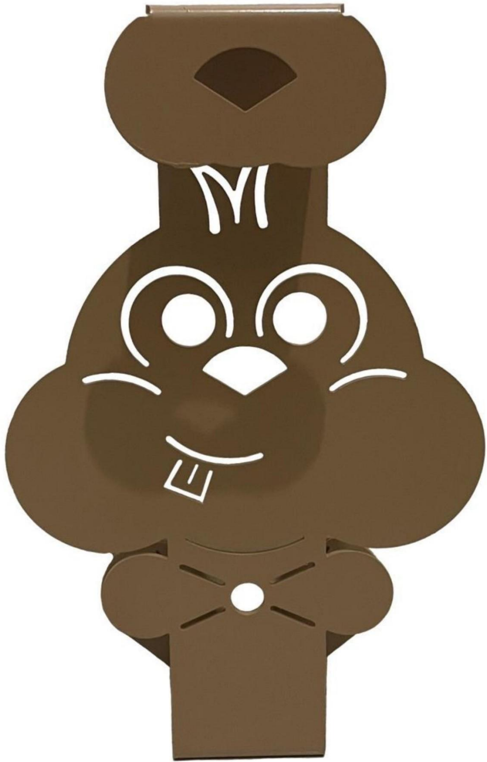
Gambar 5 - Tampak Belakang