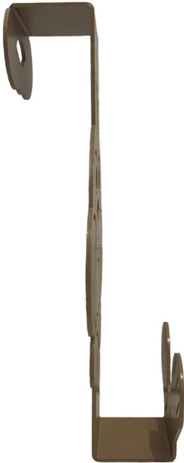
Gambar 6 - Tampak Samping Kiri