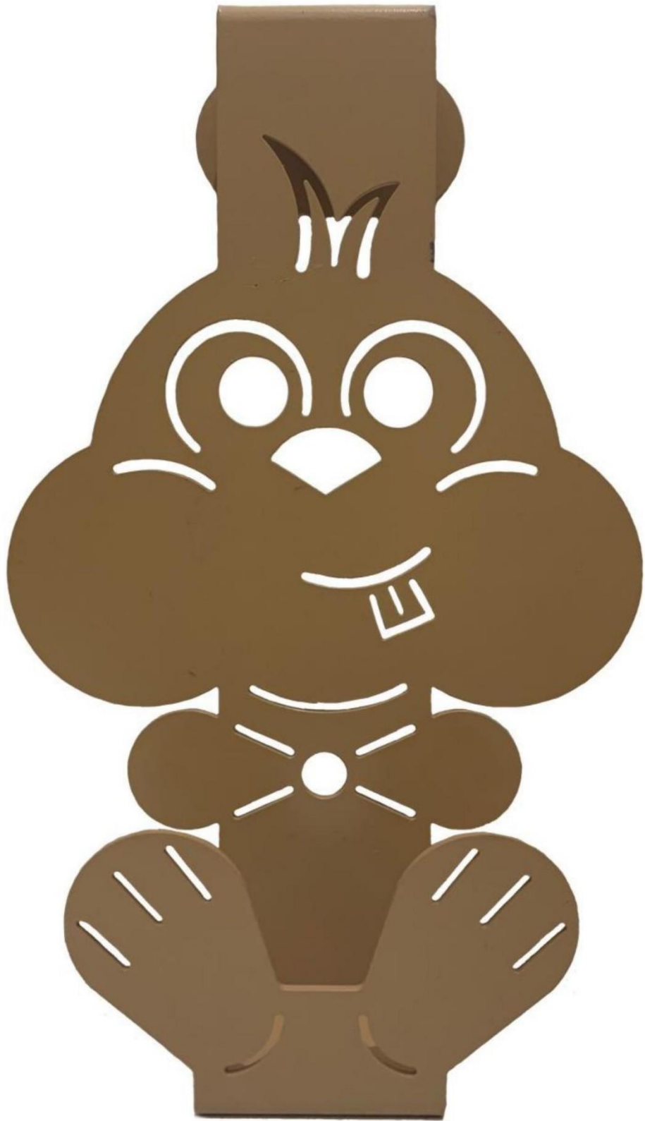
Gambar 4 - Tampak Depan