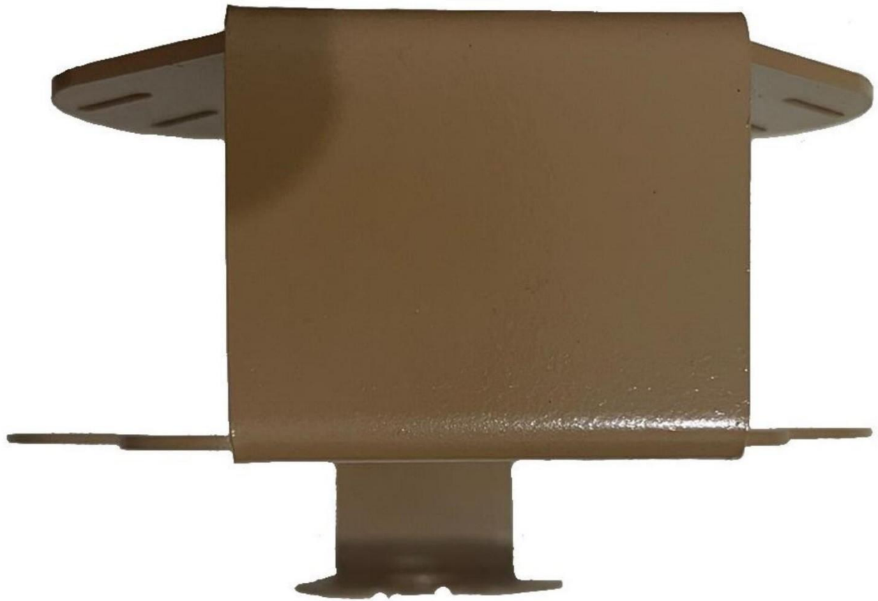
Gambar 3 - Tampak Bawah