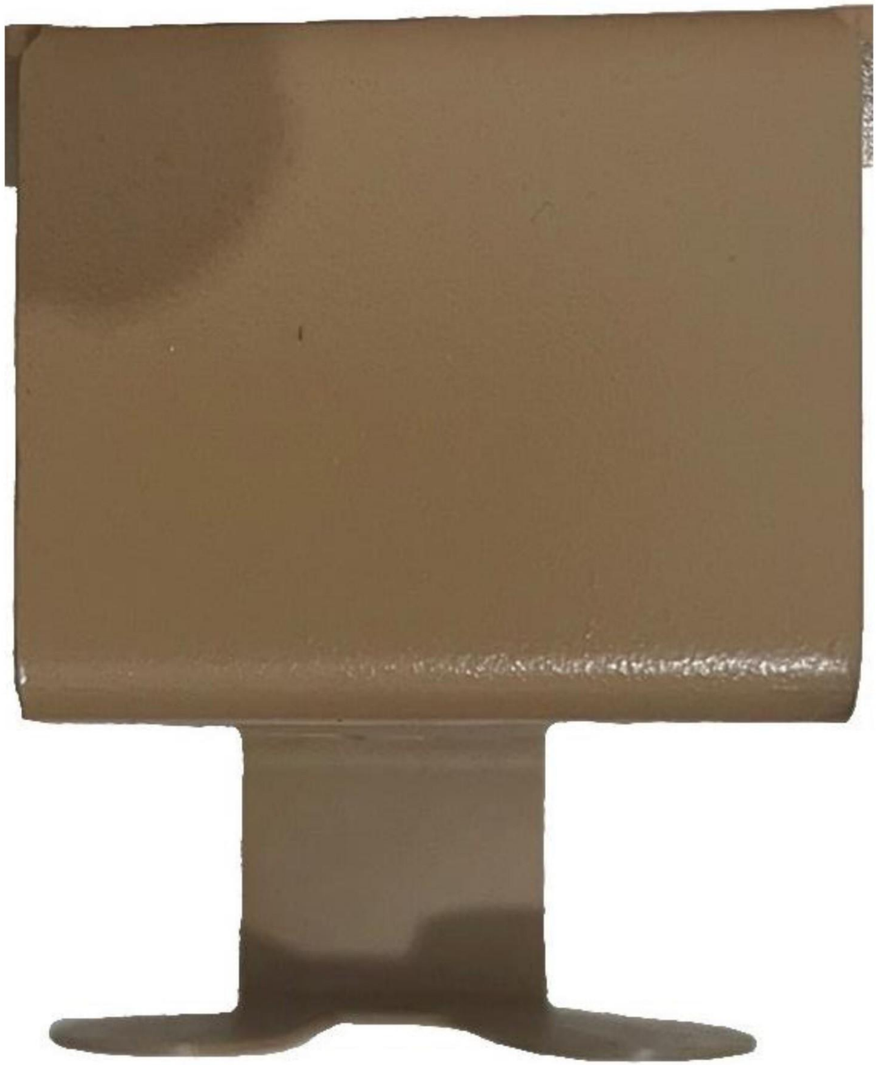
Gambar 2 - Tampak Atas