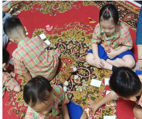
Gambar 4. Permainan Kartu Kembar Bertema Sayur

waktu. Tujuan dari permainan kartu kembar adalah untuk mengasah daya ingat dan fungsi memori serta meningkatkan kemampuan motorik yaitu daya ingat akan gambar dan juga letak posisi gambar, meningkatkan konsentrasi, dan fokus dengan mencari kartu-kartu yang sesuai.