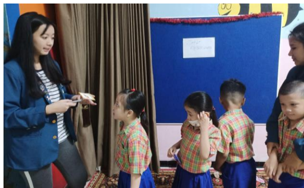
Gambar 5. Permainan Tebak Nama Sayur secara Bergiliran

Permainan tebak nama sayur dimulai dengan meminta semua siswa TK Rainbow Kiddy untuk baris membentuk rangkaian kereta. Setelah itu, secara bergiliran para siswa diminta untuk menjawab nama sayur melalui gambar yang ditunjukkan oleh wakil kelompok mahasiswa. Peran mahasiswa dalam aktivitas ini dibagi menjadi dua, yaitu satu mahasiswa akan berdiri di depan dan bertugas untuk menunjukkan gambar kartu, lalu dua mahasiswa lainnya menjaga para siswa TK agar dapat bergiliran berbaris dengan rapi membentuk rangkaian kereta. Berbaris membentuk rangkaian kereta bertujuan agar setiap siswa memiliki kesempatan menjawab secara bergiliran tanpa menyela, serta membantu masing-masing siswa untuk belajar, tidak hanya mengikuti kata teman. Selain itu, barisan ini dibentuk rangkaian kereta dengan tujuan agar para siswa TK merasa semangat sekaligus penasaran ketika menunggu giliran siswa untuk menjawab, serta agar kegiatan tidak terkesan monoton dan efektif untuk memperkenalkan nama-nama sayur yang kurang familiar.