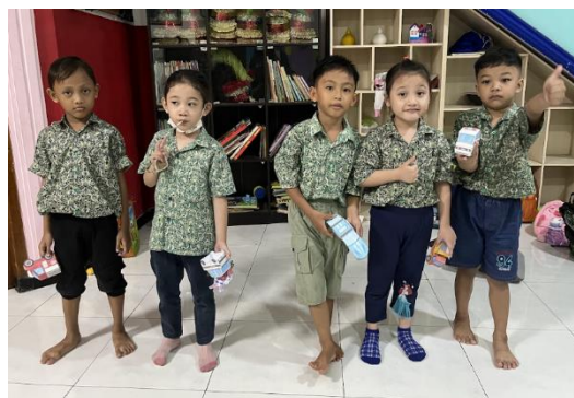
Gambar 6. Hasil Rakitan Mobil Siswa TK

Aktivitas merakit mobil yang dilakukan pada kunjungan ketiga bertujuan untuk meningkatkan keterampilan para siswa TK dalam hal kesabaran dan kreativitas. Kelompok mahasiswa menyediakan berbagai jenis mobil, mulai dari mobil balap, mobil pemadam kebakaran, mobil polisi, truk, maupun mobil biasa, dan setiap siswa diizinkan untuk memilih jenis mobil yang menarik perhatiannya. Melalui kegiatan merakit mobil, para siswa juga diberi pemahaman mengenai peran kendaraan dalam kehidupan sehari-hari, baik sebagai alat transportasi untuk memenuhi kebutuhan, maupun mobil yang diciptakan dengan tujuan untuk memuaskan keinginan saja, seperti halnya mobil balap. Dengan demikian, siswa dapat memperoleh edukasi mengenai relevansi dan fungsi kendaraan sebagai kebutuhan atau keinginan semata ketika sedang bermain merakit mobil.