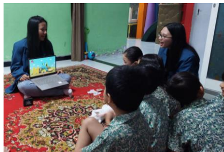
Gambar 3. Pemutaran Video Lagu Buah dan Sayur

Pengabdian masyarakat ini dimulai dengan memutar video yang berisikan nama-nama buah dan sayur sesuai dengan urutan abjad. Kegiatan ini dipilih karena dapat membantu para siswa mudah menghafalkan jenis buah dan sayur karena adanya tampilan visual serta irama yang menarik. Pengaruh media video akan lebih cepat masuk ke dalam diri manusia daripada media yang lainnya karena penayangannya berupa cahaya titik fokus, sehingga dapat mempengaruhi pikiran dan emosi manusia (Yudianto, 2017). Setelah itu, para siswa ditampilkan powerpoint yang berisikan gambar-gambar buah dan sayur yang sudah ada dalam video sebelumnya. Untuk membangun interaksi, siswa TK Rainbow Kiddy diminta untuk menyebutkan nama dan rasa dari setiap gambar yang ada. Kemudian, para siswa dijelaskan mengenai manfaat buah dan sayur bagi kesehatan tubuh serta diminta membandingkan dengan makanan-makanan yang kurang bergizi. Pemutaran video mengenai buah dan sayur membantu para siswa untuk dapat memahami keputusan yang diambil yaitu memilih makanan yang sehat seperti buah dan sayur daripada makanan ringan ataupun makanan yang manis berlebih.