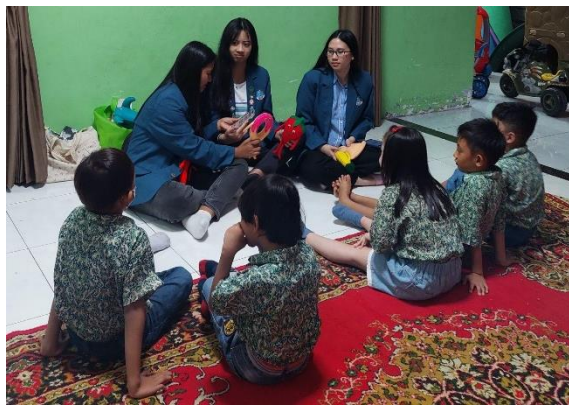
Gambar 7. Aktivitas Panggung Boneka

Penyampaian materi dilakukan dengan menyampaikan cerita yang singkat dan menarik mengenai kehidupan anak-anak pada umumnya yang diperankan oleh tokoh-tokoh berkarakter makanan. Karakter yang dipakai untuk panggung boneka adalah 3 boneka buah (pepaya, strawberry , dan pisang) dan 3 boneka junk food ( ice cream , donut, dan pizza ). Boneka buah digunakan untuk mencerminkan kebutuhan, sedangkan boneka junk food mencerminkan keinginan. Peran mahasiswa dalam melakukan aktivitas panggung boneka ini dibagi menjadi dua, yaitu satu mahasiswa berperan sebagai narator dari cerita yang dimainkan, sedangkan mahasiswa lainnya akan melakukan peragaan peran sesuai dengan karakter boneka. Setelah cerita panggung boneka selesai, para siswa diberikan beberapa pertanyaan, dan bagi siapa yang dapat menjawab akan memperoleh hadiah. Pertanyaan yang diberikan setelah selesai pertunjukan panggung boneka ditujukan untuk menilai seberapa jauh para siswa memahami isi dari cerita yang telah disampaikan. Selain itu, tujuan dari kegiatan panggung boneka ini untuk mengajarkan kepada setiap siswa TK agar bisa membedakan kebutuhan dan keinginan, dan terlebih lagi bisa memiliki kemauan untuk memprioritaskan kebutuhan.