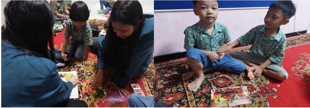
Gambar 8. Aktivitas Merakit Puzzle

Seluruh rangkaian aktivitas dari kegiatan memutar video, bermain kartu kembar, bermain tebak kartu, mewarnai, merakit mobil, panggung boneka, dan puzzle merupakan bentuk kegiatan sosial atau service learning yang telah disusun dengan harapan dapat memberikan manfaat yang berguna bagi para siswa TK dalam memahami dan mengetahui pentingnya mendahulukan kebutuhan daripada keinginan. Kegiatan dilakukan dalam berbagai metode dan aktivitas agar siswa tidak bosan dan terus bersemangat dalam belajar. Selain itu, kegiatan pengabdian masyarakat ini dilakukan untuk memberikan pengajaran mengenai perbedaan kebutuhan dan keinginan serta mengajarkan para siswa TK untuk lebih bijaksana dalam menentukan kebutuhan atau keinginan yang harus didahulukan.