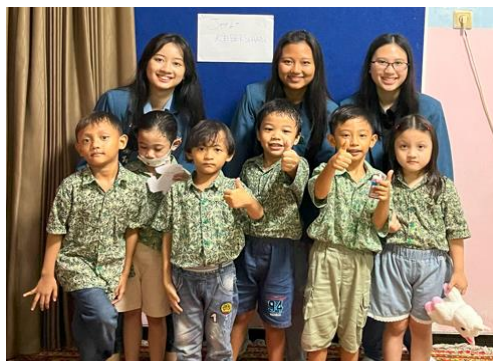
Gambar 1. Kunjungan Pertama dengan Para Siswa TK Rainbow Kiddy

Kegiatan pengabdian masyarakat yang dilakukan kelompok mahasiswa bertujuan untuk memberikan edukasi mengenai pentingnya mengetahui dan mempelajari prioritas kebutuhan sejak usia dini. Harapan dari kegiatan pengabdian masyarakat ini adalah para siswa dapat mulai membedakan mana saja yang menjadi kebutuhan maupun keinginan, yang dapat berdampak baik bagi masa depannya sehingga dapat menjadi mengurangi belanja-belanja yang hanya untuk memenuhi keinginan. Selain itu, hidup dengan memprioritaskan kebutuhan dapat membantu anak-anak TK untuk hidup lebih sehat baik secara jasmani maupun dalam keuangannya.