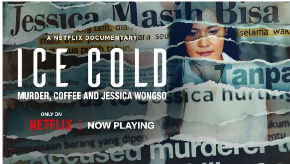
Gambar 2. Poster Film Ice Cold yang tayang di platform streaming Netflix

Wawancara dengan sutradara film Rob Sixsmith dihentikan secara tiba-tiba dan dilarang selamanya karena percakapan menjadi "terlalu dalam." Ruang sidang digambarkan sebagai "stadion sepakbola", dengan penonton yang terus-menerus bersorak dan berseru.