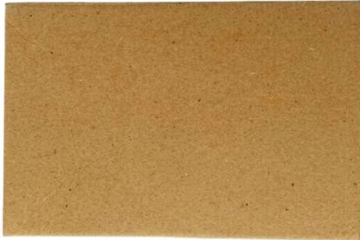
Gambar 3 - Tampak Bawah