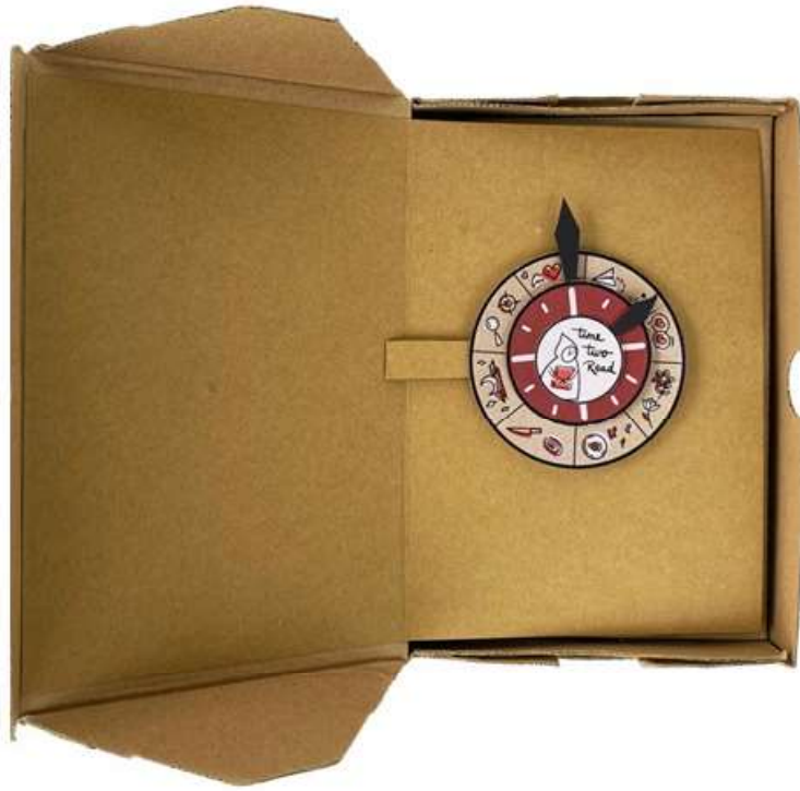
Gambar 2 - Tampak Atas