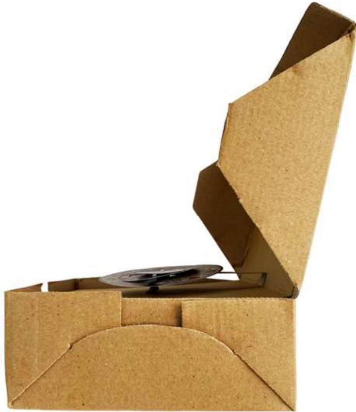
Gambar 7 - Tampak Samping Kanan