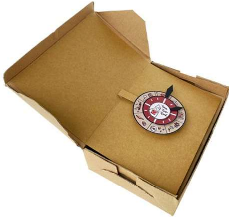
Gambar 1 - Tampak Perspektif