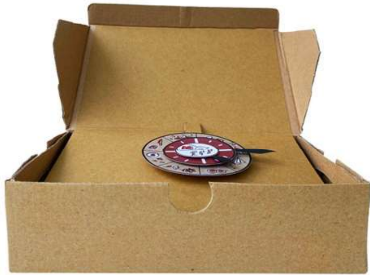
Gambar 4 - Tampak Depan