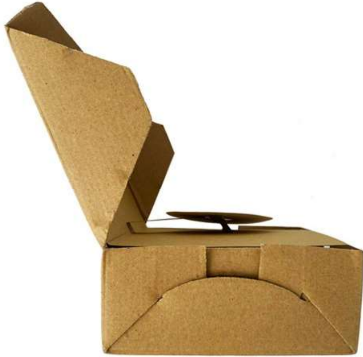
Gambar 6 - Tampak Samping Kiri