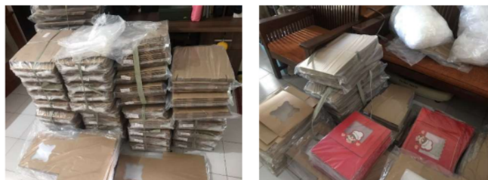
Gambar 2. Produk UMKM Ojicstore