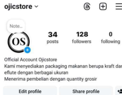
Gambar 1. Media sosial Instagram UMKM Ojicstore Surabaya

Kemudian pada pelatihan ini juga dilakukan pemberian materi tentang promosi seperti pentingnya meningkatkan kesadaran merek, produk, serta layanan. Pelatihan dilanjutkan dengan materi pembuatan konten-konten seperti video tutorial melipat packaging makanan, video cara memakai packaging makanan, feeds atau gambar terkait packaging makanan (Gambar 2), pembagian promo atau voucher diskon untuk pembeli, hingga giveaway untuk meningkatkan daya tarik audiens (Gambar 3).