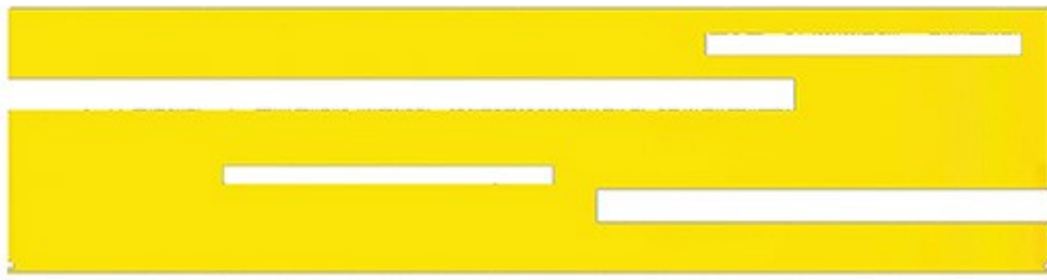
Gambar 2 - Tampak Atas