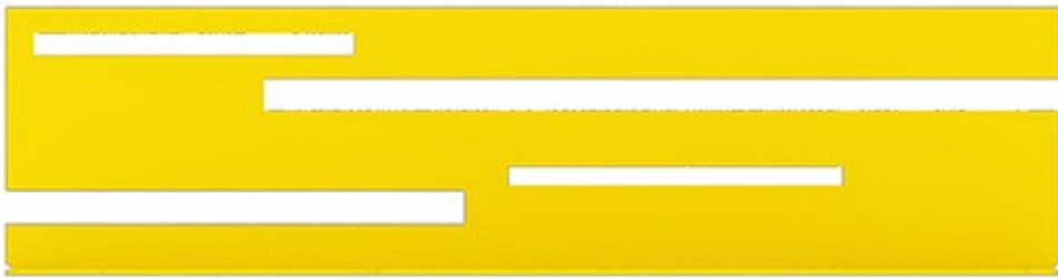
Gambar 3 - Tampak Bawah