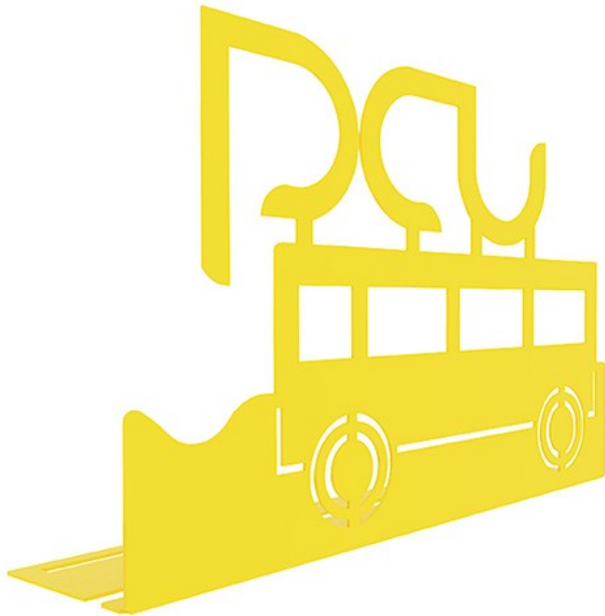
Gambar 1 - Tampak Perspektif