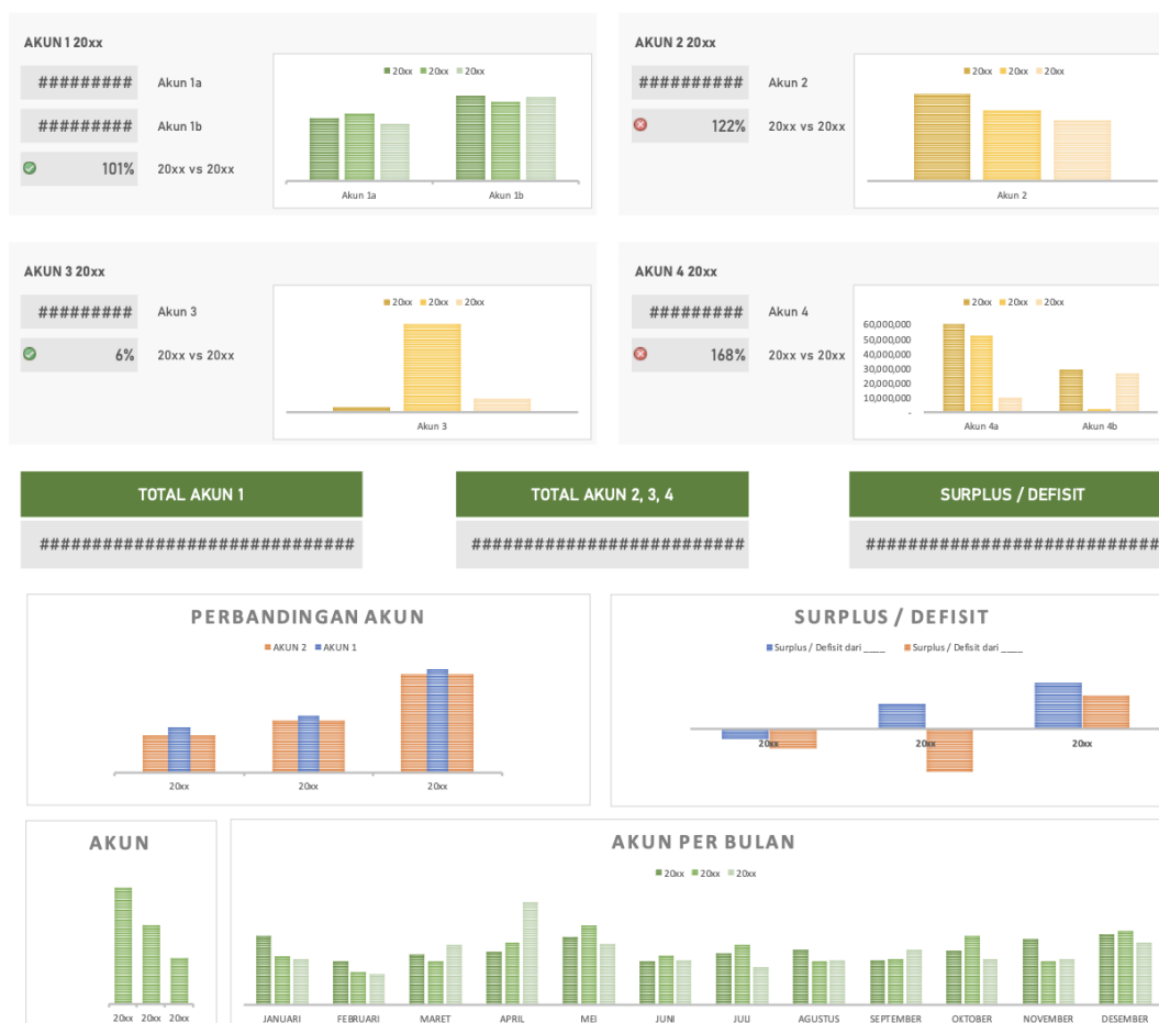
Gambar 9. Tampilan grafik

Pada awal pelaksanaan kegiatan pengabdian masyarakat, memang terdapat tantangan untuk menyamakan persepsi dengan bendahara gereja, terutama dalam memodifikasi pola pencatatan dan pelaporan keuangan yang telah digunakan selama bertahun-tahun. Namun, melalui koordinasi yang intensif dan diskusi berkelanjutan antara penulis dan mitra pengabdian, kesulitan tersebut berhasil diatasi, sehingga proses pelaksanaan menjadi semakin lancar dari tahun ke tahun.