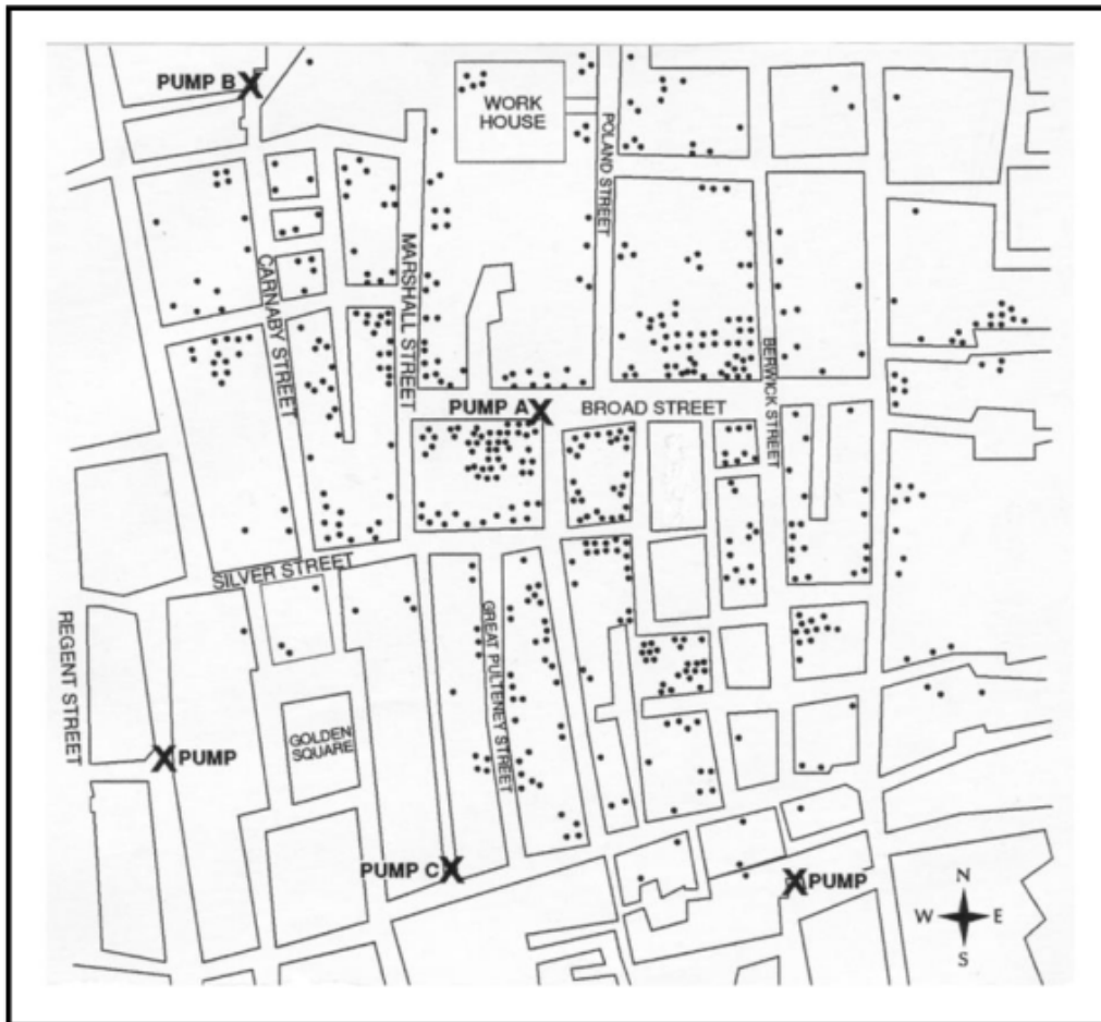
Gambar 1.2: Titik Lokasi Kematian Masyarakat Akibat Kolera di Golden Square, London (Digambar Ulang Sesuai Aslinya)